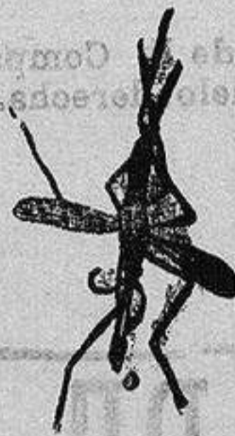
ANOFELE Mosquito que propaga la fiebre palúdica

Tos Tose el que quiere, pues ninguna tos resiste 24 horas á los Bizcochos Pectorales Roselló . Cajas 2 reales, frasco, 6. Farmacias y droguerías. Depósito en Alicante, farmacia de Aznar.