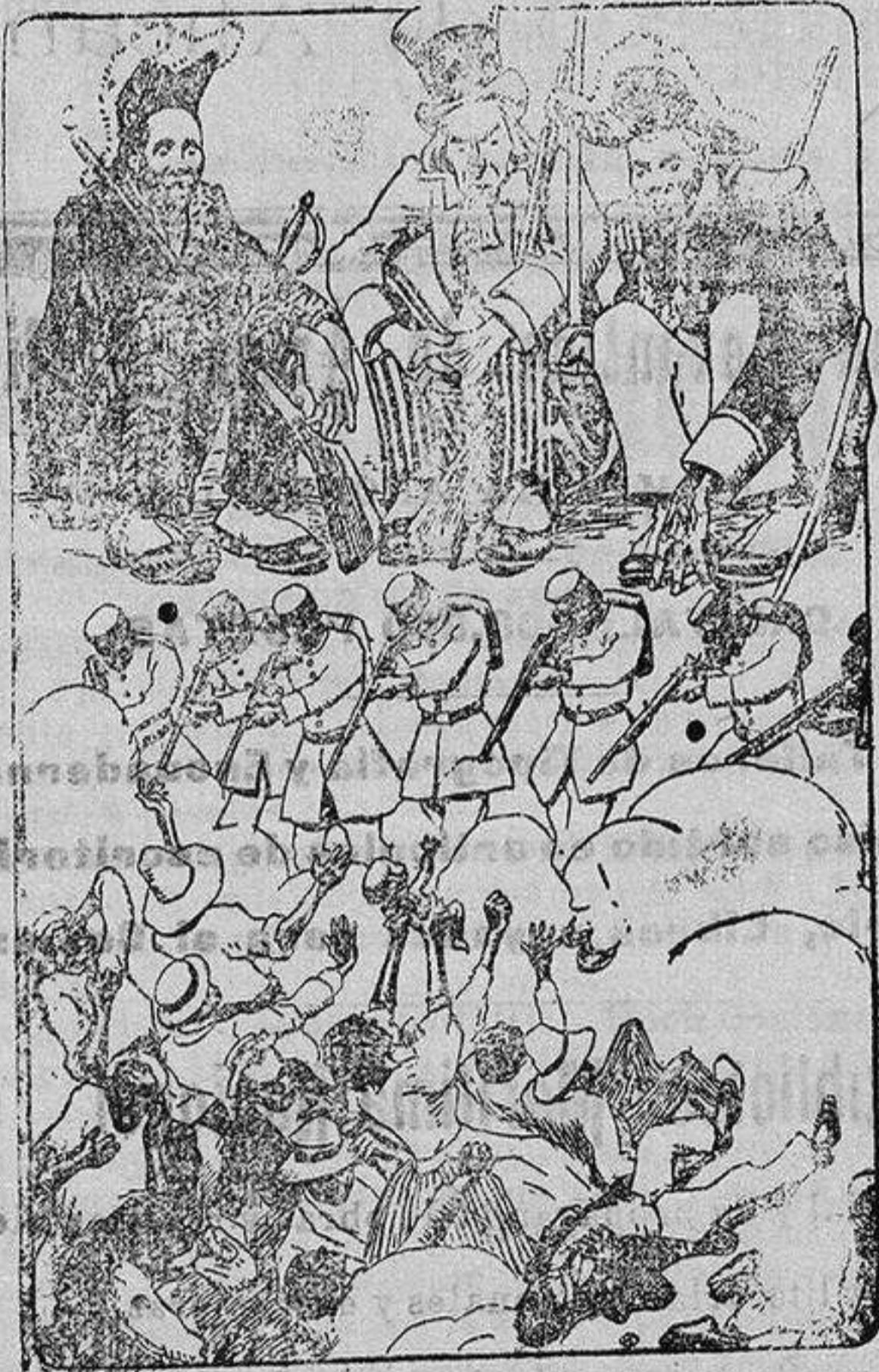
Una nueva aplicación de la doctrina de Monroe (De «Hojas Selectas» revista para todos)