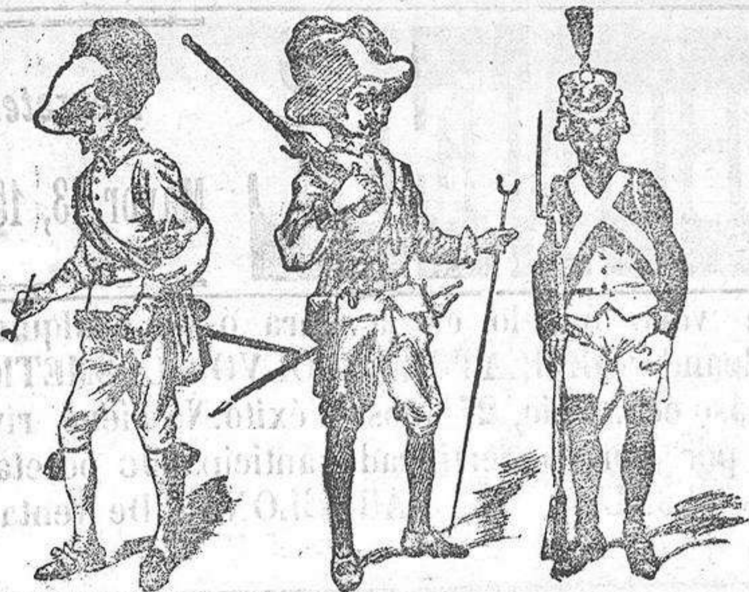
Capitán (Tercios de Flandes) Arcabucero (Antiguos Tercios) Soldado (en 1808)

La festividad de la Purísima Concepción, patrona del arma de Infantería, trae á la memoria las glorias que enaltecieron á dicha arma y el importante papel que desempeñó cuando bajo el mando del Gran Capitán Gonzalo de Córdoba, daba á su rey envidiados territorios y fama inmortal á sus armas vencedoras.