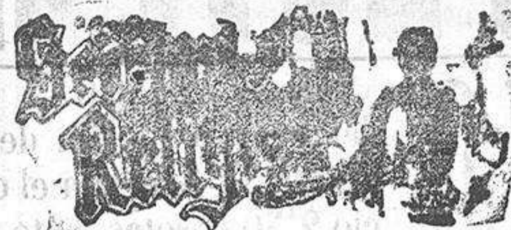
Santo de hoy: P. C. de Ntra. Señora. Santo de mañana: Santa Leocadia.

Para caballero hay un gran surtido en cortes de traje y pantalones, última creación, como también en abrigos, tanto en pieza, como confeccionados.