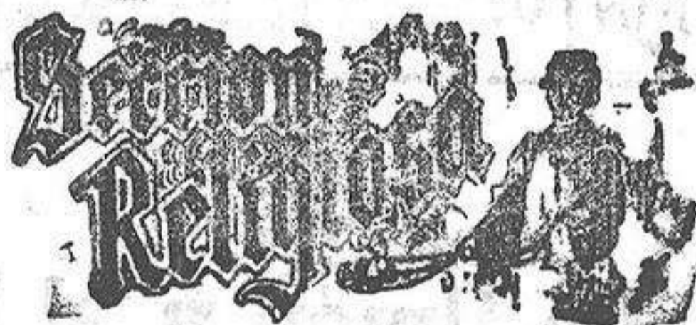
Santo de hoy: San Estaquio Santo de mañana: San Mateo

Han dado principio los populares «Viernes» y «Sábado», con saldos, retales y gangas á la cuarta parte de su valor.