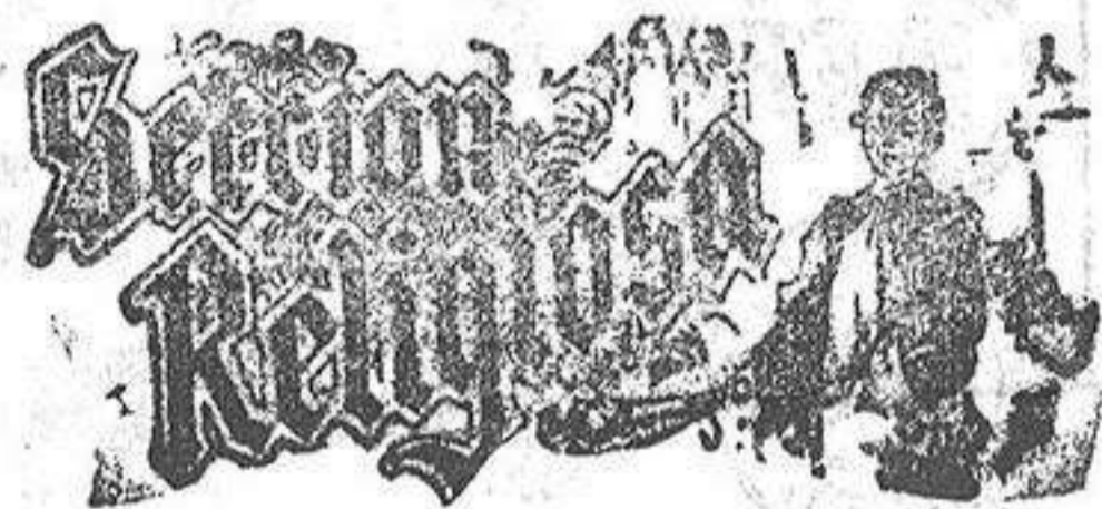
Santo de hoy: San Agustín Santo de mañana: San Juan

Han dado principio los populares «Viernes» y «Sábado», con saldos, retales y gangas á la cuarta parte de su valor.