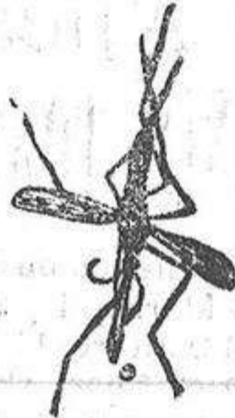
ANOFELE Mosquito que propaga la fiebre palúdica

Rogamos á los señores Doctores, que lo ensayen en los casos que resultaron incurables con cualquier otro tratamiento, con la seguridad de que después no lo abandonarán nunca.