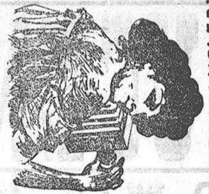
RAMON PI Y TOMAS

La correspondencia a La Papelera Española.—Alicante.