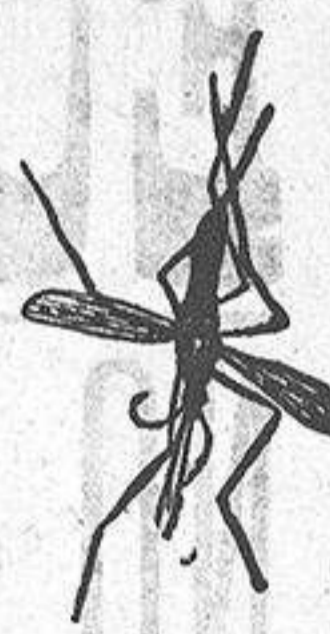
ANOFELE Mosquito que, pro-paga la fiebre palúdica.