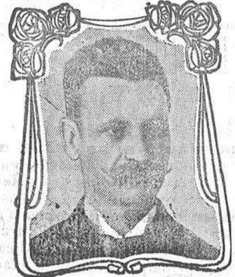
Sr. D. Antonio José de Almeida