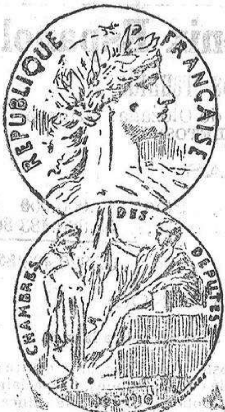
MEDELLA DE LOS DIPUTADOS FRANCESES PARA LA NUEVA LEGISLATURA

Se ha comenzado a arreglar los desperfectos causados.