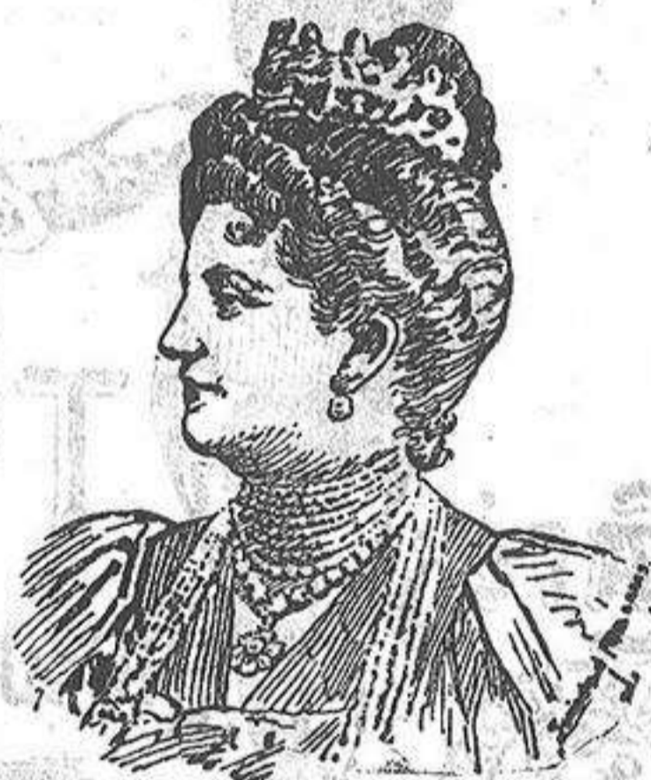
La Reina madre de Italia

Les VIERNES y SABADOS saldos, retales y gangas.