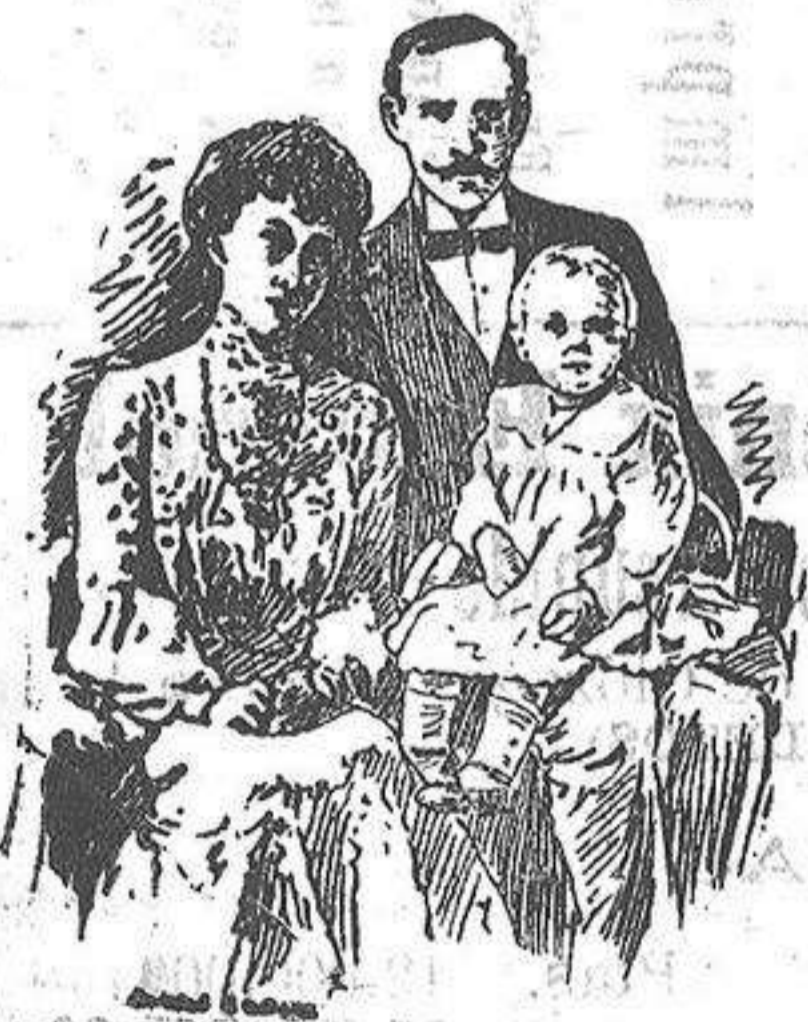
Los Reyes de Noruega