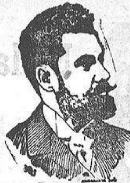
Don Santiago Alba Gobernador Civil de Madrid

Horas de despacho: de nueve á una. Labradores 7, entresuelos.