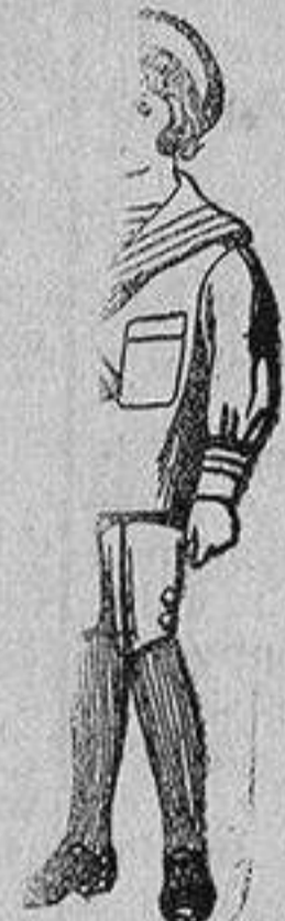
Trajes de jerga azul bordado oro en la manga para niños de 4 a 9 años De 20 a 22 ptas.