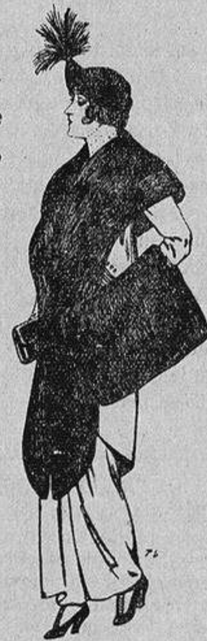
Juego de pieles de loutre de Nord para Señora 145 ptas.

Ropas confeccionadas para Caballero, Señora, Niño y Niña