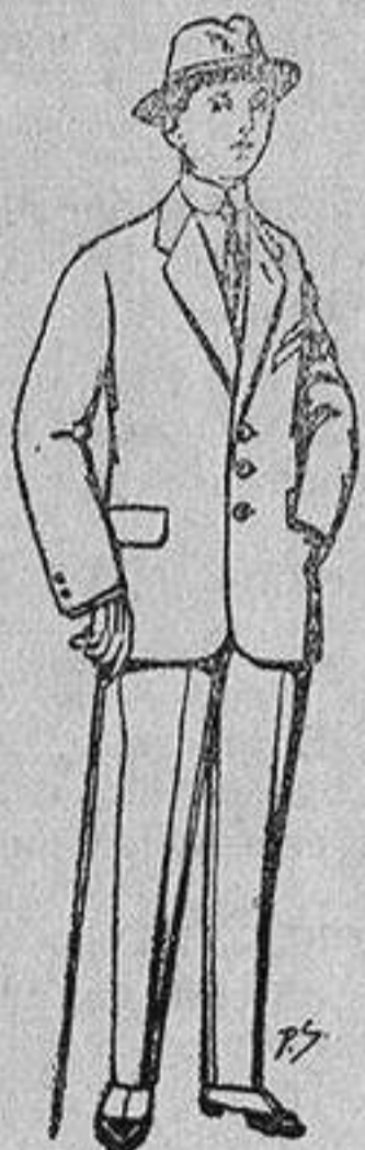
Trajes de paten, vicuña, etc., para niños de 10 a 16 años De 13 a 48 ptas.