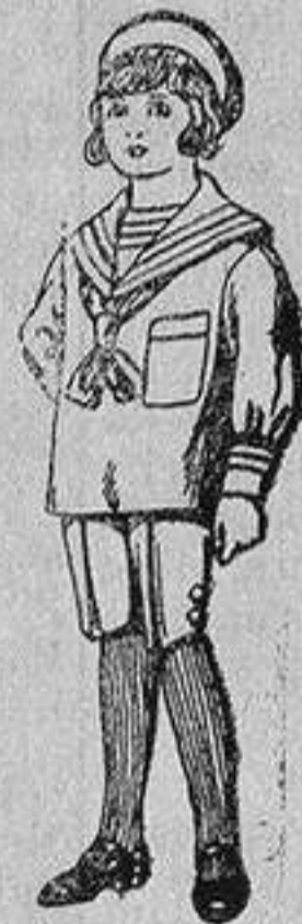
Trajes de jerga azul bordado oro en la manga para niños de 4 a 9 años De 20 a 22 ptas.

Ropas confeccionadas para Caballero, Señora, Niño y Niña