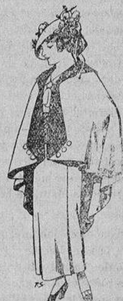
Capas de lana par jovencitas de 13 a 16 años A 25 pesetas