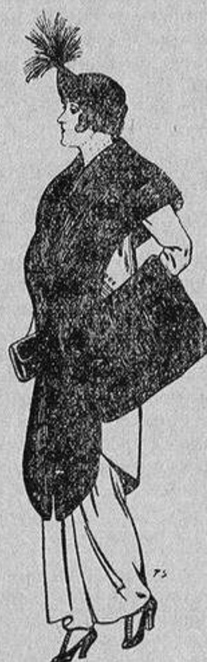
Juego de pieles de loutre de Nord para Señora 145 ptas.