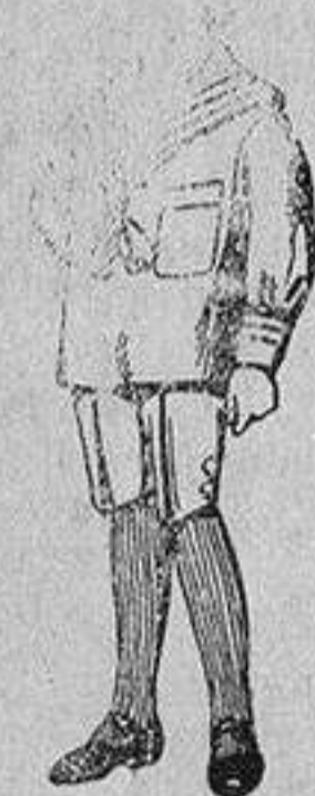
Trajes de jerga azul bordado oro en la manga para niños de 4 a 9 años De 20 a 22 pts

Ropas confeccionadas para Caballero, Señora, Niño y Niña