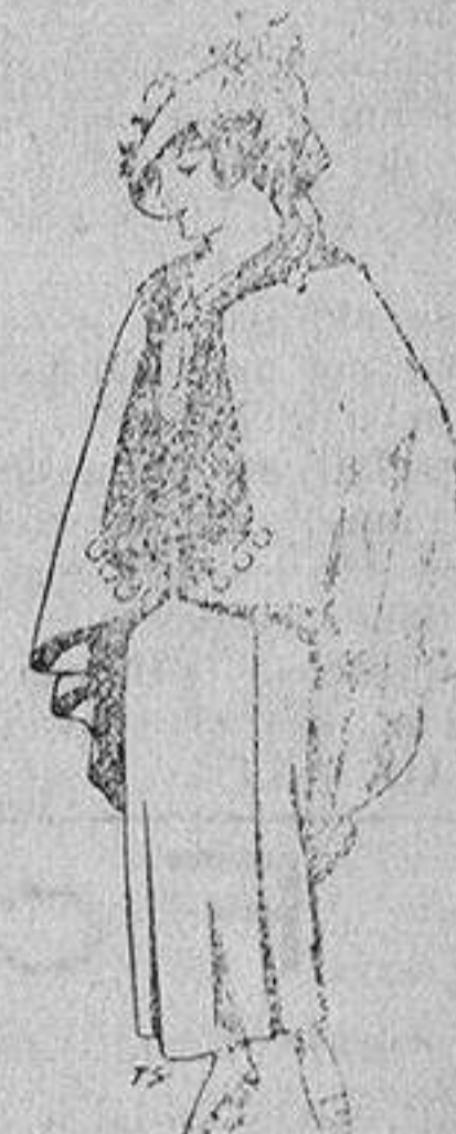
Capas de lana para jovencitas de 13 a 16 años A 25 pesetas

SECCIONES: Peletería, Camisería, Gé-neros de Punto, Corbatería, Guante-ría, Sombrerería, Zapatería, Paraguas, Bastones y Artículos de Viaje.