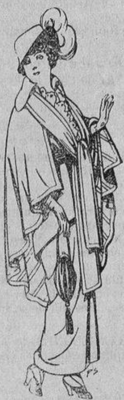
Capas de lana para se fiora A 20 ptas.