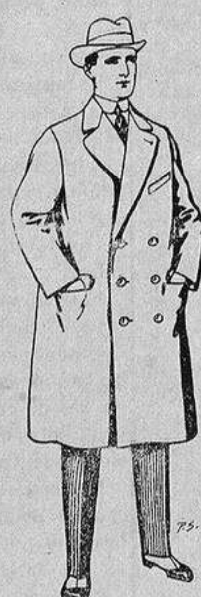
Gabanes de patén y cheviot De 55 a 105 ptas.