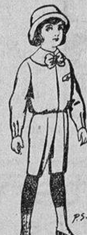
Trajes pátén para niños de 4 a 9 años De 5 a 5'50 ptas.