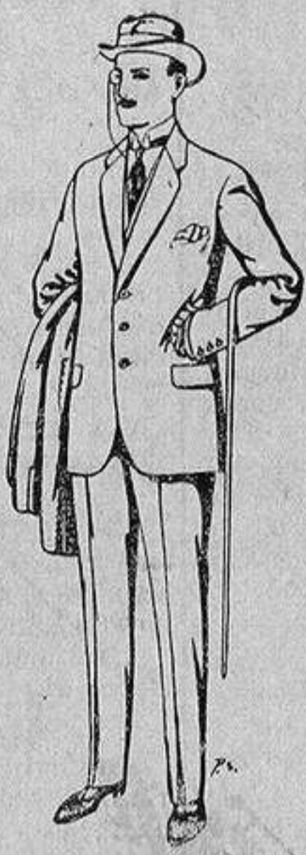
Trajes de patén, cheviot, etc. De 17'50 a 70 ptas.