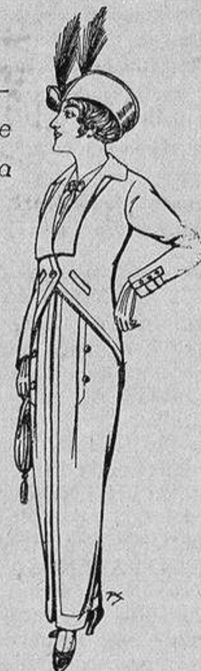
Trajes jerga negra para Señora 65 ptas.