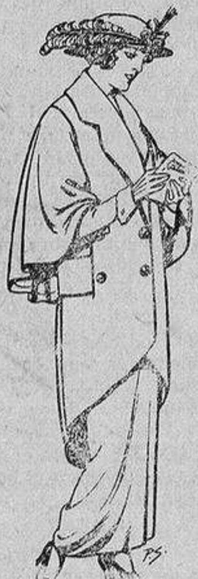
Abrigos de patén para Señora De 55 a 65 ptas.