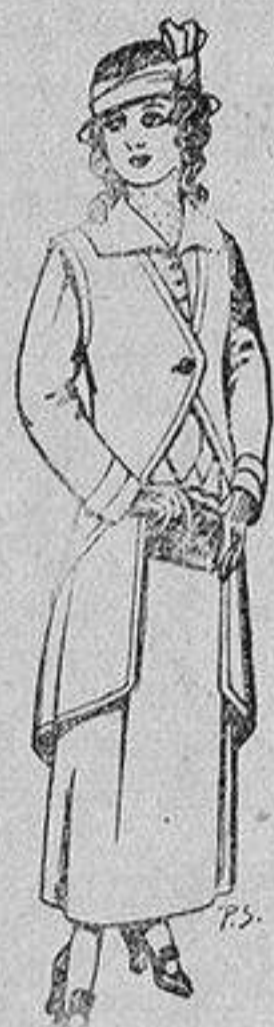
Trajes de lanilla para jovencitas de 13 a 16 años De 40 a 45 ptas.