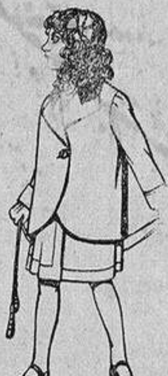
Trajes de lanilla para niños de 4 a 12 años De 14 a 22 ptas.