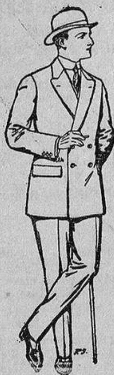
Trajes de cheviot, patén, etc. De 25 a 80 ptas.

Madrid, Barcelona, Alicante, Almería, Bilbao, Gá-diz, Cartagena, Gijón, Granada, Málaga, Palma de Mallorca, Santander, Sevilla, Valencia, Valladolid y Zaragoza