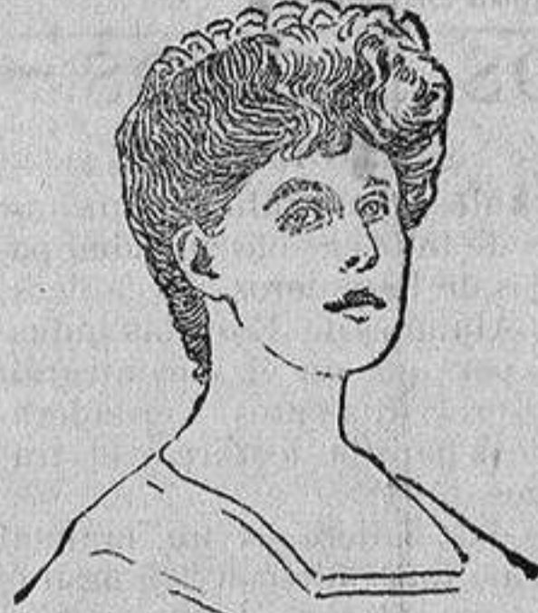
LA REINA MARIA nueva soberana de Rumanía