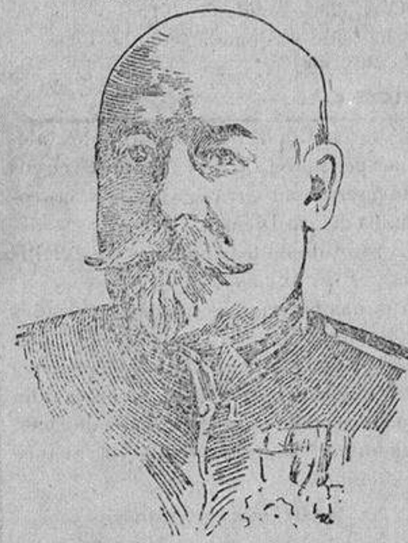
GENERAL SOUKHOMLINOFF ministro de la Guerra ruso