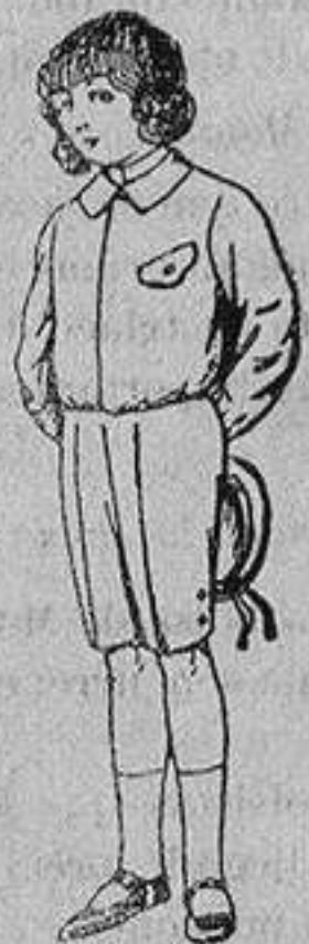
Trajes de lanilla, vicuña o jerga, para niños de 4 a 9 años De Ptas. 5 a 10