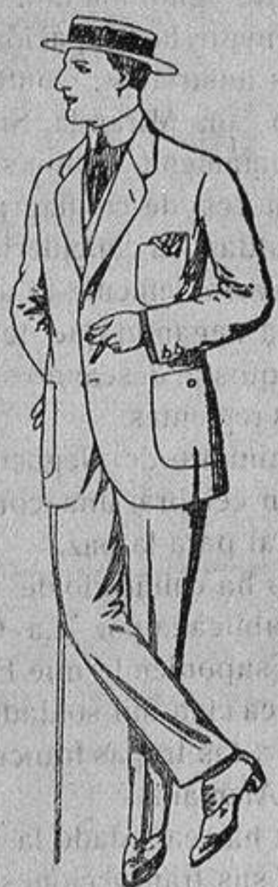
Trajes de dril crudo kaki o listado De Ptas. 10 a 32

Madrid, Barcelona, Alicante, Almeria, Bilbao, Cádiz, Cartagena, Gijón, Granada, Málaga, Palma de Mallorca, Santander, - Sevilla, Valencia, Valladolid y Zaragoza -