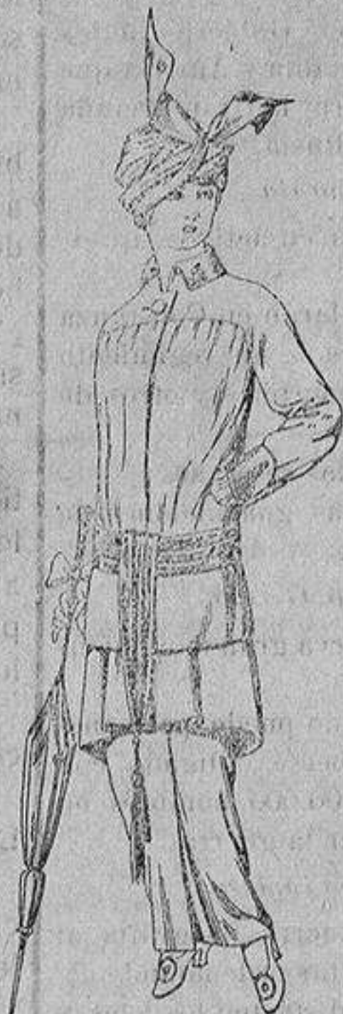
Traje de jerga azul o negra y géneros novedad, para señora De Ptas. 65 a 80