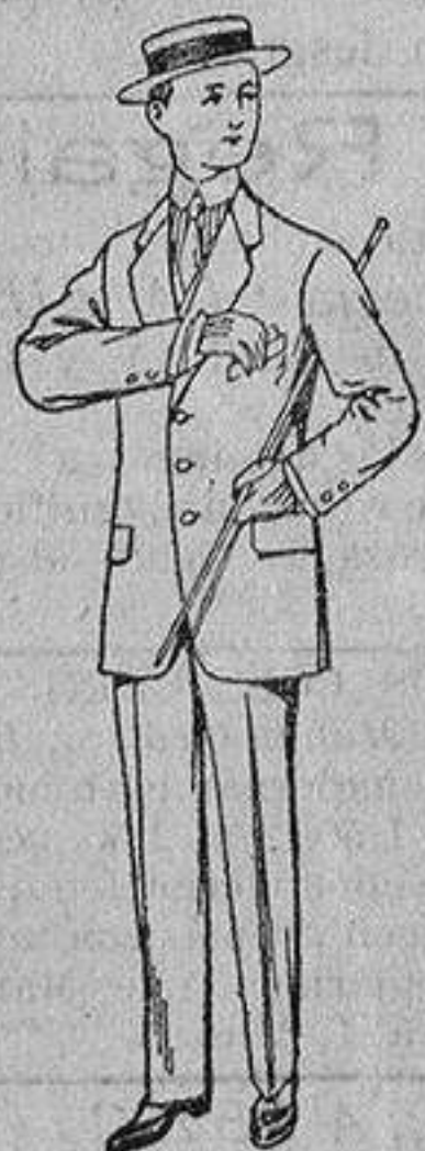
Trajes de nanilla vicuña, etc., para niños de 10 a 15 años De Ptas. 14 a 48