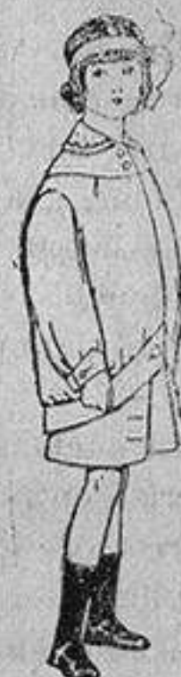
Trajes de lanilla para niños de 4 a 12 años De Ptas. 20 a 30

SECCIONES: Camisería, Géneros de Punto, Corbatería, Guantería, Sombrerería, Zapatería, Paraguas, Bastones y Artículos para Viaje.