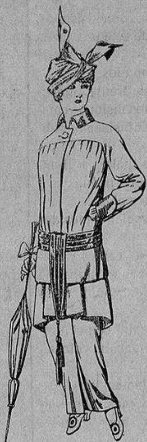
Traje de jerga azul o negra y géneros novedad, para señora De Ptas. 65 a 80