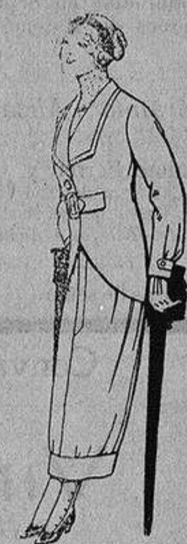
Trajes de lanilla para jovencitas de 13 a 16 años A Ptas. 27