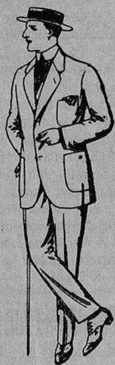
Trajes de dril crudo kaki o listado De Ptas. 10 a 32

Madrid, Barcelona, Alicante, Almería, Bilbao, Cádiz, Cartagena, Gijón, Granada, Málaga, Palma de Mallorca, Santander, - Sevilla, Valencia, Valladolid y Zaragoza -