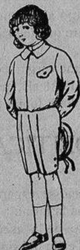
Trajes de lanilla, vicuña o jerga, para niños de 4 a 9 años De Ptas. 5 a 10

Ropas confeccionadas para Caballero, Señora, Niño y Niña