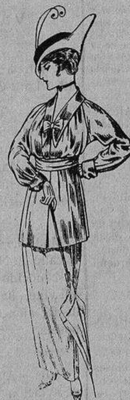
Vestido de lana negra o azul para señora De Ptas. 35 a 40