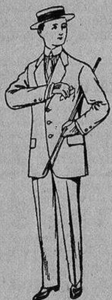
Trajes de nanilla vicuña, etc., para niños de 10 a 15 años De Ptas. 14 a 48