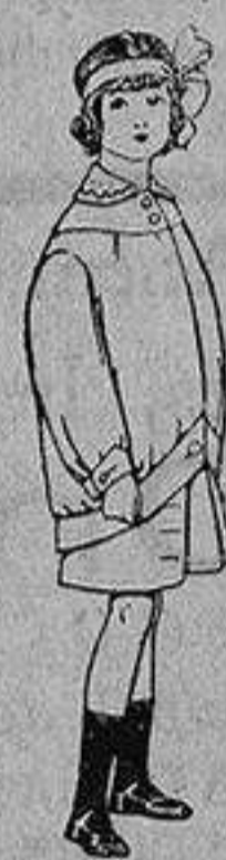
Trajes de lanilla para niños de 4 a 12 años De Ptas. 20 a 30

PRECIO FIJO y VENTAS AL CONTADO. PÍDASE EL CATALOGO GENERAL.