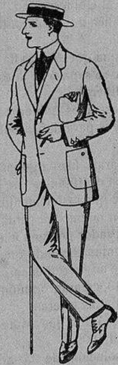
Trajes de dril crudo kaki o listado De Ptas. 10 a 32

Madrid, Barcelona, Alicante, Almería, Bilbao, Cádiz, Cartagena, Gijón, Granada, Málaga, Palma de Mallorca, Santander, - Sevilla, Valencia, Valladolid y Zaragoza -