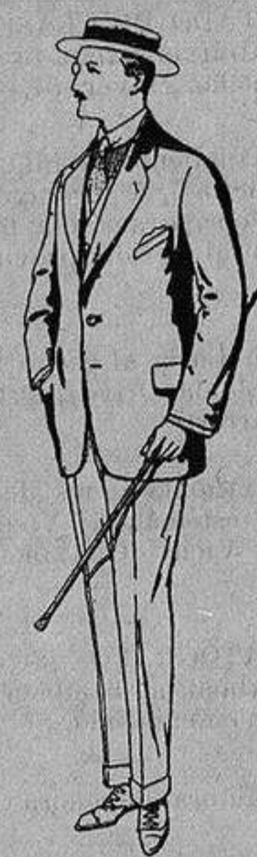
Trajes de alpaca ugra De Ptas. 32 a 56