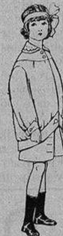
Trajes de lanilla para niños de 4 a 12 años De Ptas. 20 a 30