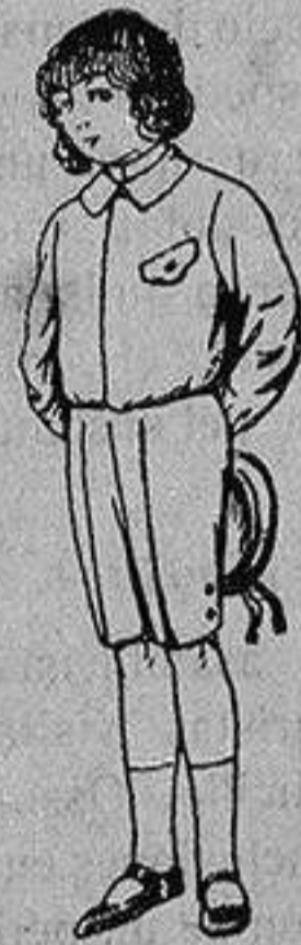
Trajes de lanilla, vicuña o jerga, para niños de 4 a 9 años De Ptas. 5 a 10