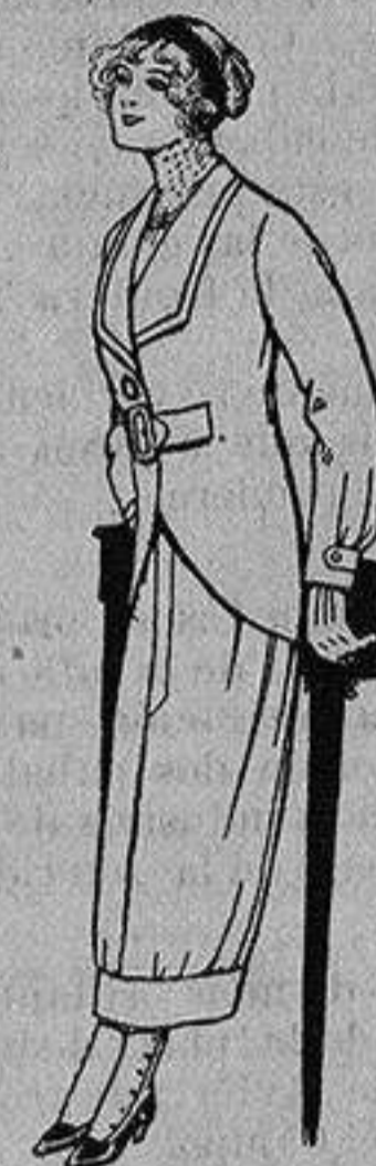
Trajes de lanilla para jovencitas de 13 a 16 años A Ptas. 27