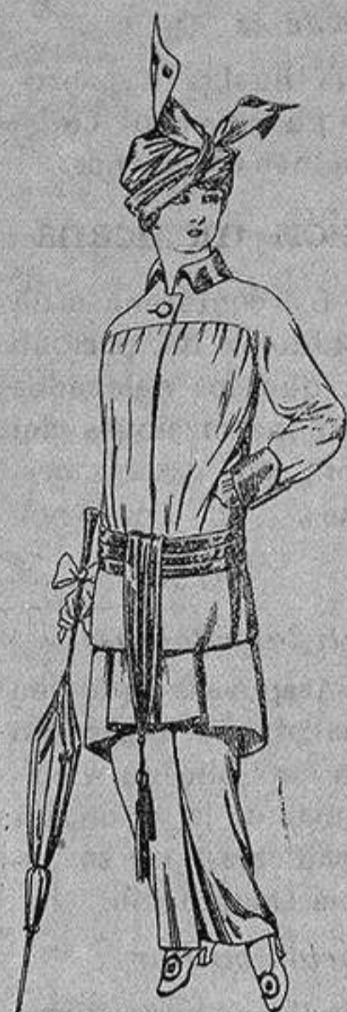
Traje de jerga azul o negra y géneros novedad, para Señora De Ptas. 65 a 80