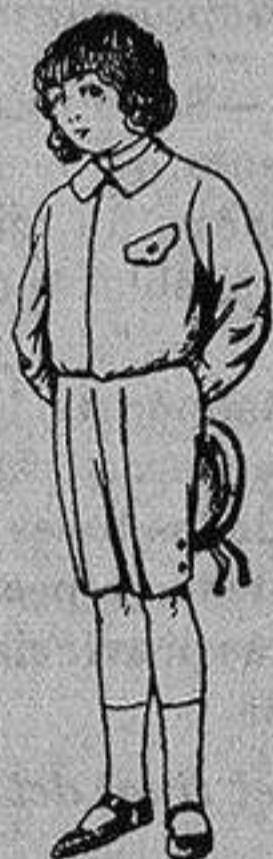
Trajes de lanilla, vicuña o jerga para niños 4 a 9 años De Ptas. 5 a 10

SECCIONES: Camisería, Géneros de Punto, Corbatería, Guantería, Sombrerería, Zapatería, Paraguas, Bastones y Artículos para Viaje.