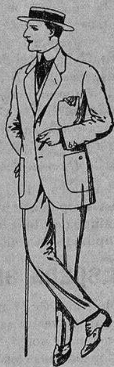
Trajes de dril crudo kaki o listado De Ptas. 10 a 32

Madrid, Barcelona, Alicante, Almería, Bilbao, Cádiz, Cartagena, Gijón, Granada, Málaga, Palma de Mallorca, Santander, Sevilla, Valencia, Valladolid y Zaragoza.