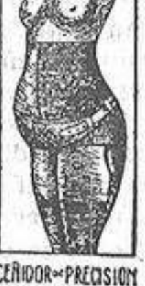
HERNIA DE LA PARED ABDOMINAL