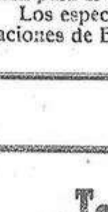
HERNIA DE LA PARED ABDOMINAL

sin operación ni molestias con el herniario IDEAL MORA, última creación de la Ortopedia moderna. La segura eficacia de este aparato es un remedio radical para curar toda clase de Hernias (Quebraduras), por rebeldes y voluminosas que sean incluso las reproducidas después de la operación.