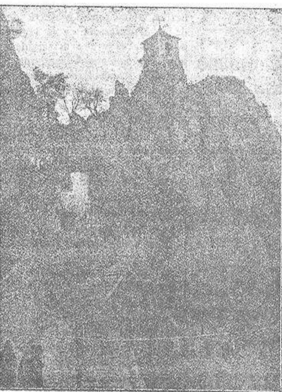
La subida al pueblo

Parece imposible llegar a aquella altura. Minutos después, sin embargo, estamos en un rincón de la carretera, junto a unas casas. El campanario de Guadalest—sobre unas rocas—nos muestra su triste—muda y desahogada—silueta típica. Una empinada rampa—como estante adosado a los montes—hácenos ver la profundidad del valle de los espinos. Al final, una casona con puerta en arco y única ventana, da noción de vida al silencioso ambiente. Por fin, ciérrase nuestro camino. Parece que estemos al final de la ruta; mas un túnel nos abre paso... La iglesia, con interesantes retablos e imágenes, con su correspondiente cripta, y la Casa señorial de los Orduña, aparece de pronto. Modestas casonas. Y la del Ayuntamiento—modestísima—al lado opuesto de la plazuela. Súbese a esa casa consistorial por una escalera que termina en balcón, ante la puerta de la «Sala». Unas