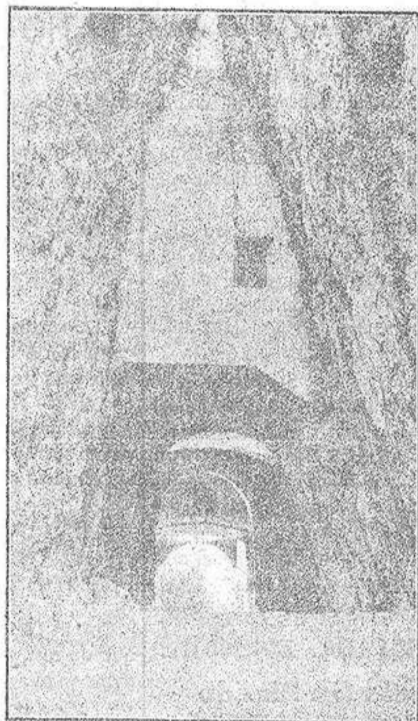
La entrada al pueblo