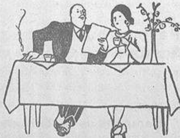
VICTORIA HOTEL ALICANTE

de todas clases, con referencias calzadas, solicita para Canarias agente colegiado, bien relacionado en todas las islas. Referencias a disposición de las casas interesadas. J. PEREIRA.—Duggi, 45. Santa Cruz de Tenerife