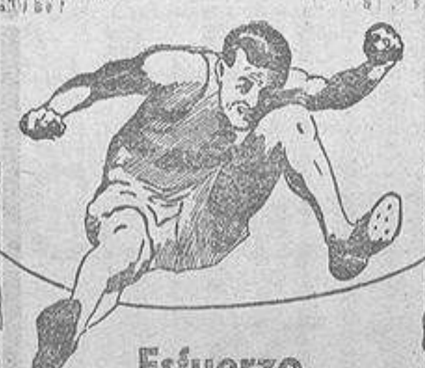
Esfuerzo hasta el límite

Y este hombre no es un revolucionario exaltado ni un irremediable vociferador de mítines ni un desposeído de la fortuna, que no tiene nada que perder, como decimos en España. Este hombre es el candidato de la mayoría de la nación alemana, para ocupar la Presidencia de la República en la próxima espiración de poderes del general Hindenburg, y es—para que no parezcan volanderas sus palabras—, autor de un libro recién publicado con el título «Fin de las reparaciones» que es su manifiesto político. Así, la inestabilidad, la inseguridad del Banco de Pagos Internacionales, fundado sobre el plan Young, a merced de las pasiones desatadas en el centro de Europa, es evidente. ¿Que beneficios puede reportar a España ligar su situación financiera a esa institución y poner su peso a esa aventura y entregar su oro a quienes, en poco tiempo y sin hosigamientos que ya co-