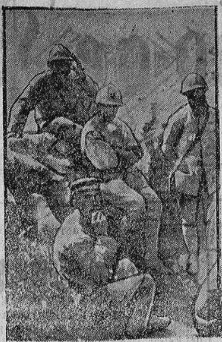
En las posiciones tomadas