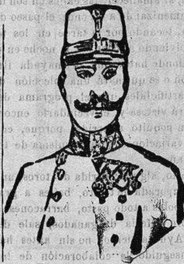
El general austro húngaro BOHEM ERMOLL, comandante del ejército austro-alemán que ha recobrado Tarnopol y se halla muy próximo a la frontera oriental de la Galitzia.