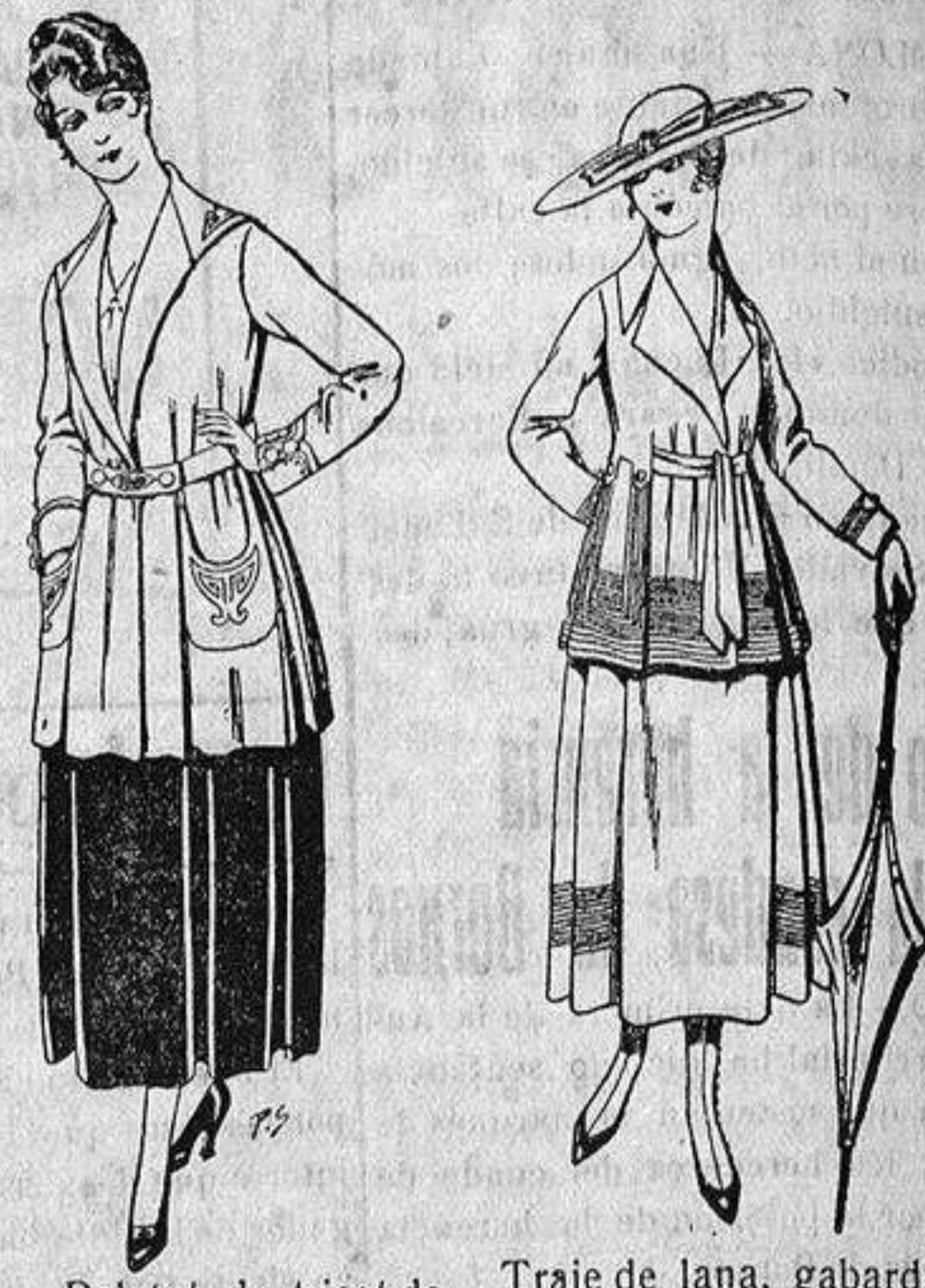
Paletot de tricot de seda o lana. De ptas. 14 a 57.