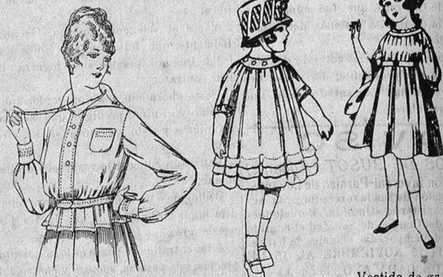
Blusa batista blanca, cuello con calados. A ptas. 4'50.

Gamisería, Géneros de Punto, Corbatería, Guantería, Sombrerería, Zapatería, Bastones, Paraguas y Artículos de Viaje