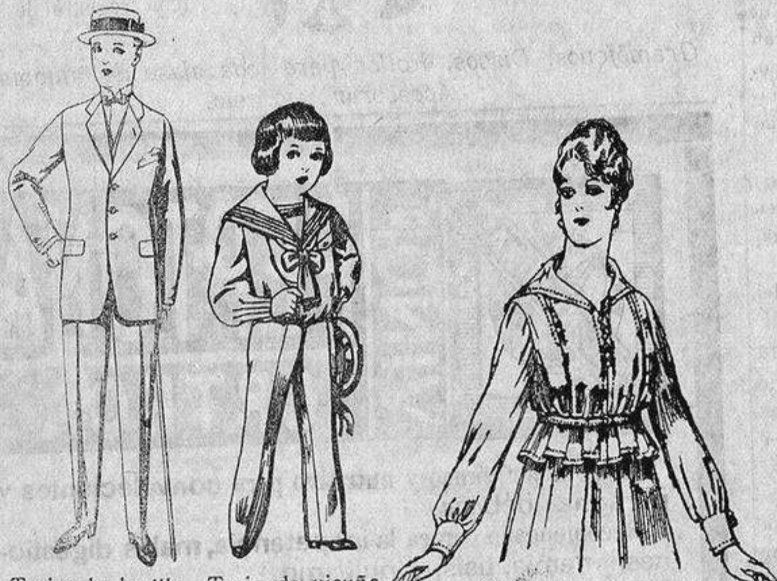
Trajes de lanilla, vicuña, etc., para jovencitos de 10 a 17 años. De ptas. 17 a 50. Traje de vicuña ó jerga azul y negra, para niños de 4 a 9 años. De ptas. 7'50 a 22.