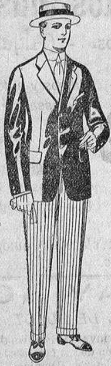
Traje de alpaca negra. De ptas. 32 a 56. Pantalones de franela blanca o listada. De ptas. 15 a 25.

Madrid, Barcelona, Alicante, Almería, Bilbao, Cádiz, Cartagena, Gijón, Granada, Málaga, Palma de Mallorca, Santander, Sevilla, Valencia, Valladolid y Zaragoza.