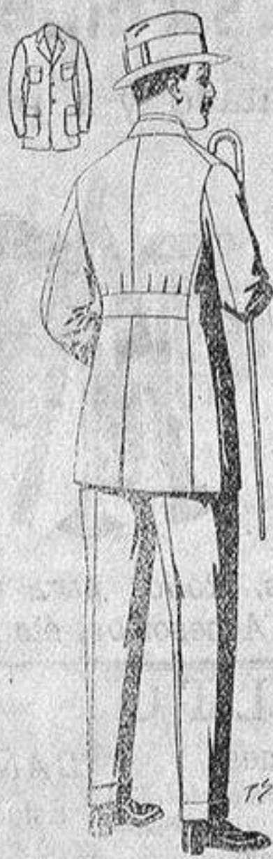
Traje modelo sport, de lanilla, cheviot, etc. De ptas. 35 a 70. Los mismos en dril, beige o kaki. De ptas. 15 a 38.