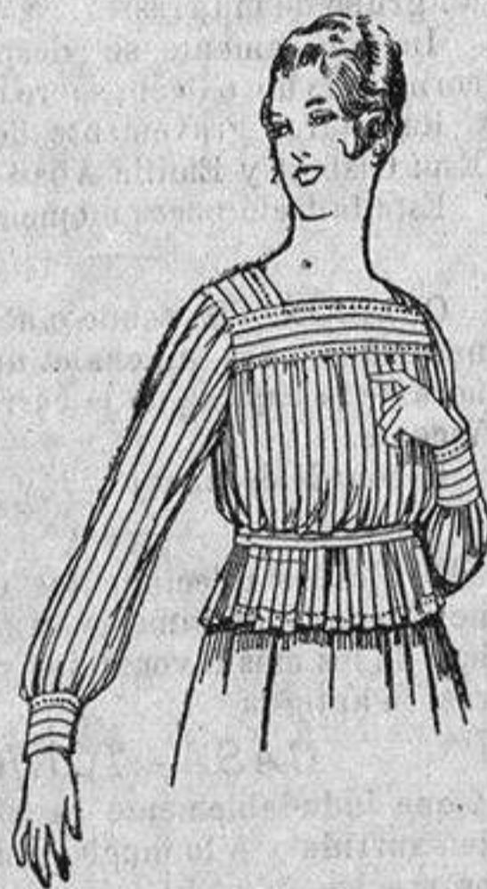
Blusa de batista listada. a ptas. 4'50.

Ropas confeccionadas para Caballero Señora, Niño y Niña