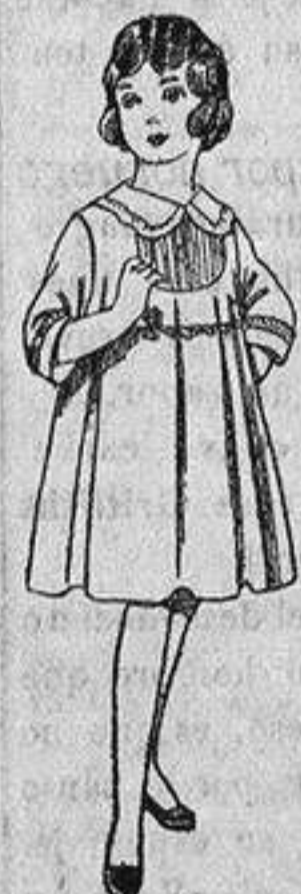
Vestido de lanilla azul, con bordados, para niñas de 4 a 9 años. De ptas. 22 a 28.