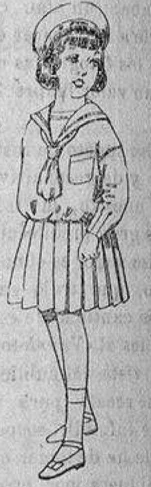
Trajes marinera, de lanilla azul, para niñas de 4 a 9 años. Ptas. 32 a 38.