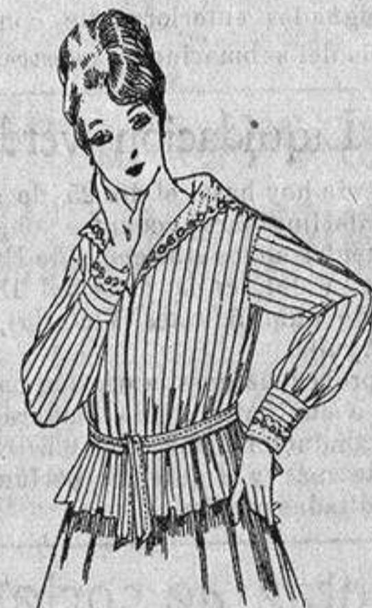
Blusa voile listada, cuello organdín bordado. a ptas. 9'50.

Gamisería, Géneros de Punto, Gorbatería, Guantería, Sombrerería, Zapatería, Bastones, Paraguas y Artículos de Viaje