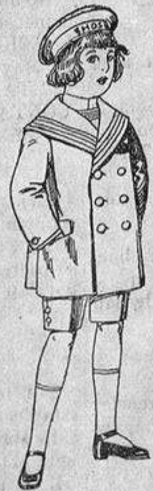
Traje matelot de vicuña o jerga azul para niños de 4 a 9 años. De ptas. 14 a 32.