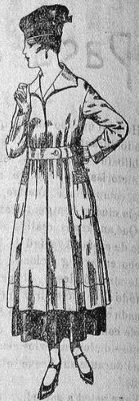
Abrigo de tricot de lana colores lisos. De ptas. 63 a 75.