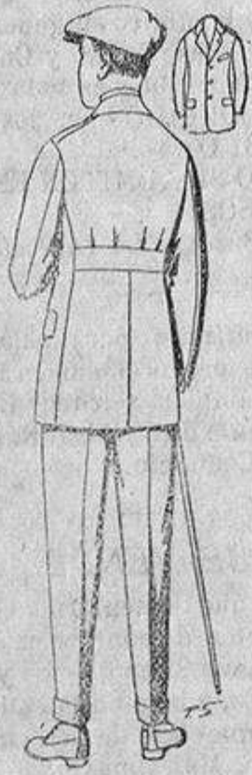
Traje modelo sport, de lanilla, melton, etc., para jovencitos de 10 a 16 años. De ptas. 27 a 52. Los mismos en dril. De ptas. 11 a 21.