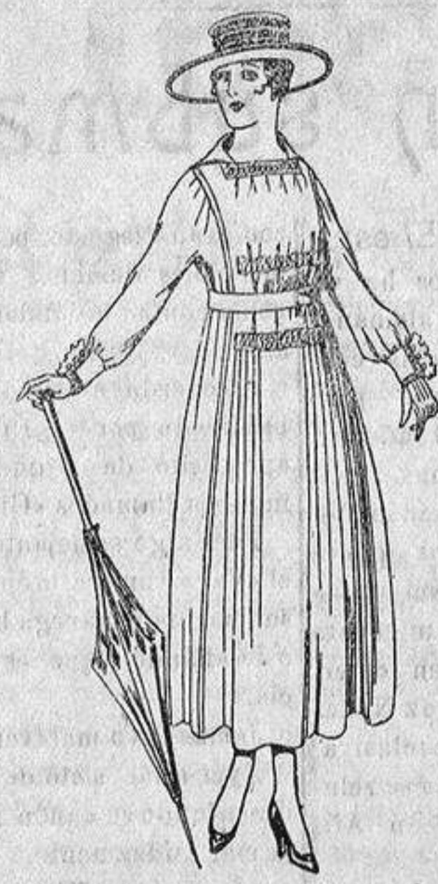
Vestido de lanilla, negro, azul y color. De ptas. 60 a 70.