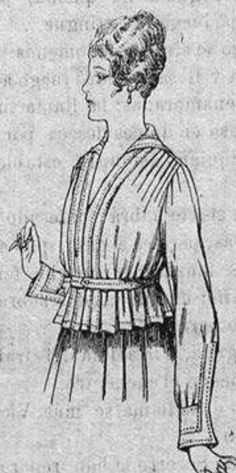
Blusa batista blanca A ptas. 5'75

Gamisería, Cáñeros de Punto, Corbatería, Guantería, Sombrerería, Zapatería, Bastones, Paraguas y Artículos de Viaje