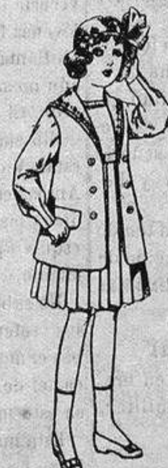
Traje de gabardina blanco, cuello de organdín bordado, para niñas de 4 a 9 años. De ptas. 22 a 24