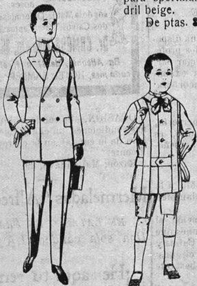
Traje de estambre, vicuña o jerga para jovencitos de 10 a 16 años. de ptas. 19 a 50