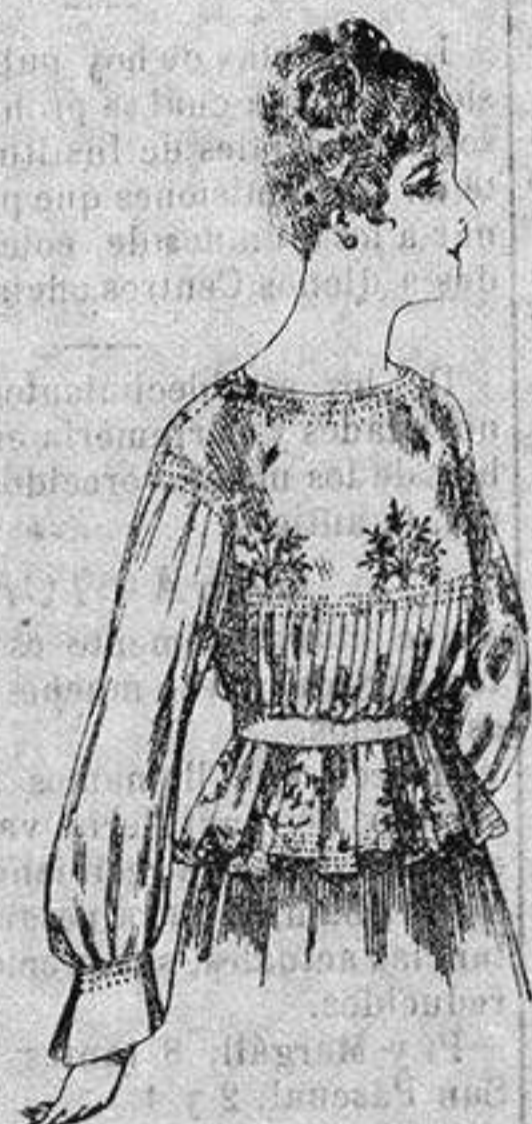
Blusa de crepón o seda, en negro, azul y color. de ptas. 33 a 35

Ropas confeccionadas para Caballero Señora, Niño y Niña