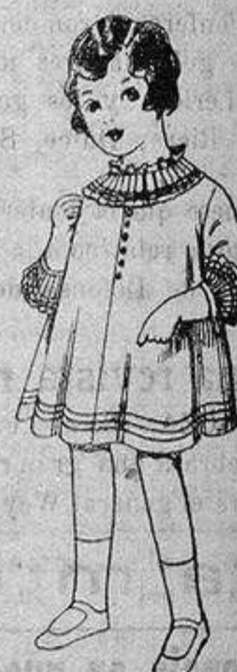
Vestido de voile blanco bordado. De ptas. 6'75 a 8