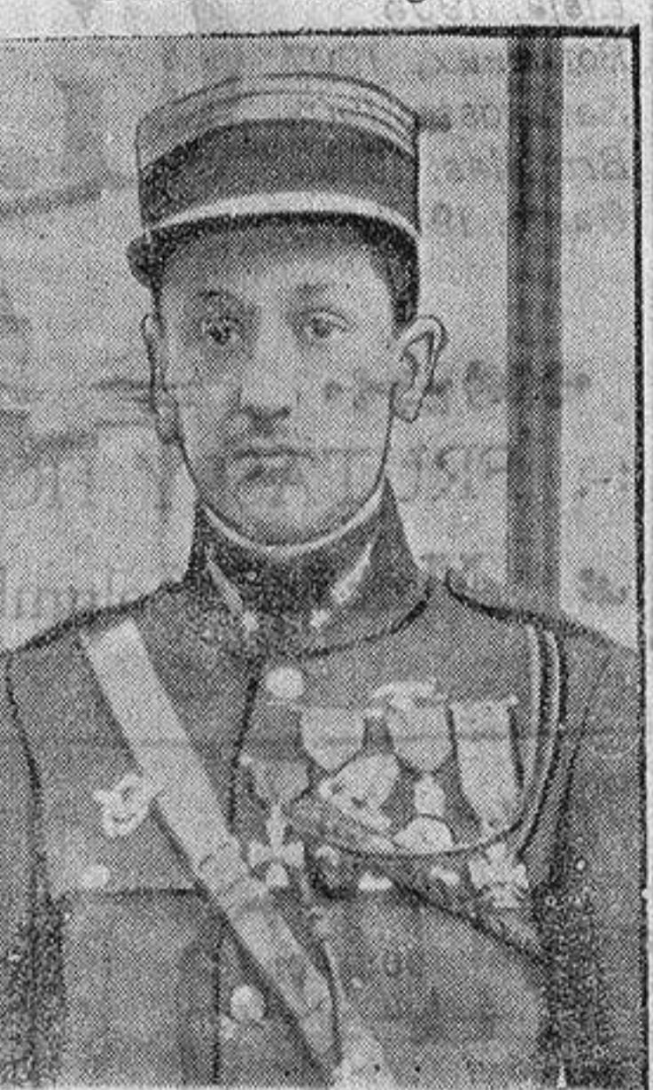
El capitán francés Cuymer que ha abatido 35 aviones alemanes

TELEFONOS: 2172 HULL, 4 THRON, 59 GOOLE, 19 IMMINGHAM, 3769 GLASGOW (City), 4767 Camb.-Newcastle-Ontario.