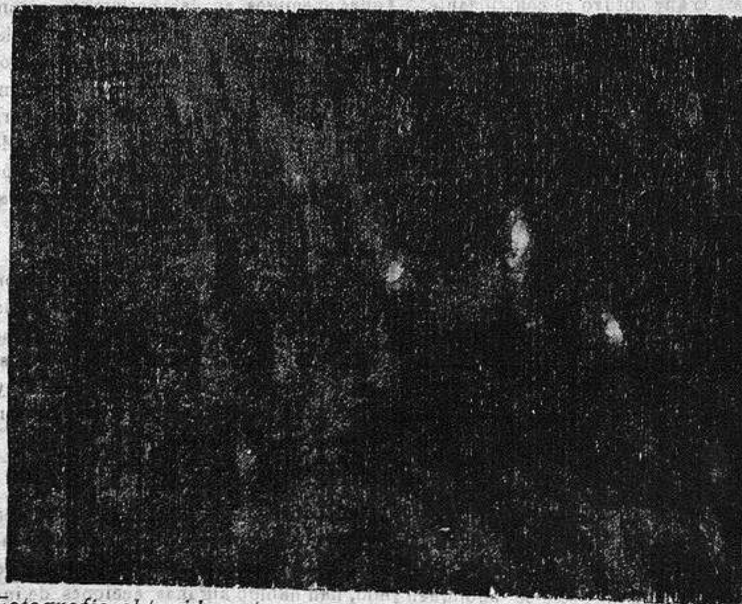
Fotografía obtenida esta mañana por nuestro compañero señor Bluff, con autorización especial. (Prohibida la reproducción)