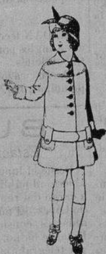
Abrigos de patén para niños de 4 a 12 años De ptas. 15 a 25