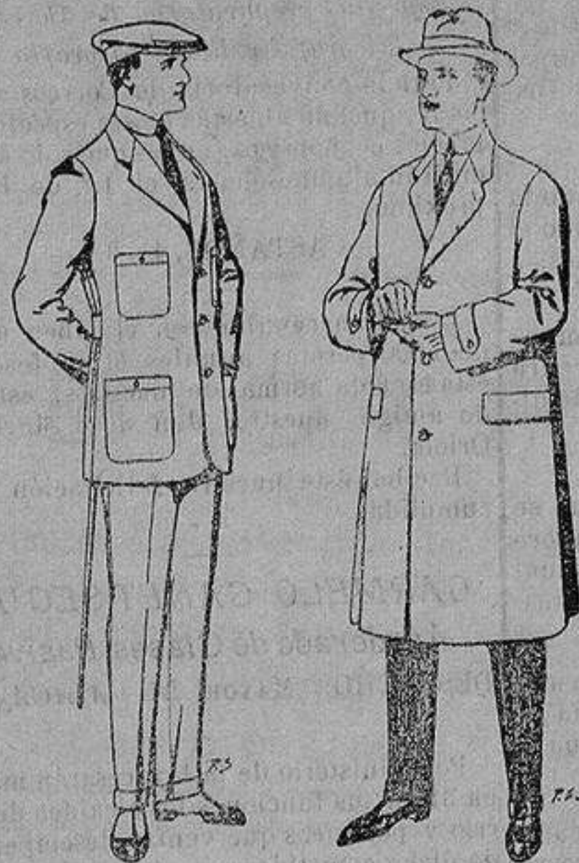
Trajes de cheviot corte elegante para «Sportman» De 35 a 50 ptas.

Madrid, Barcelona, Alicante, Almería, Bilbao, Cádiz, Cartagena, Gijón, Granada, Málaga, Palma de Mallorca, Santander, Sevilla, Valencia, Valladolid y Zaragoza