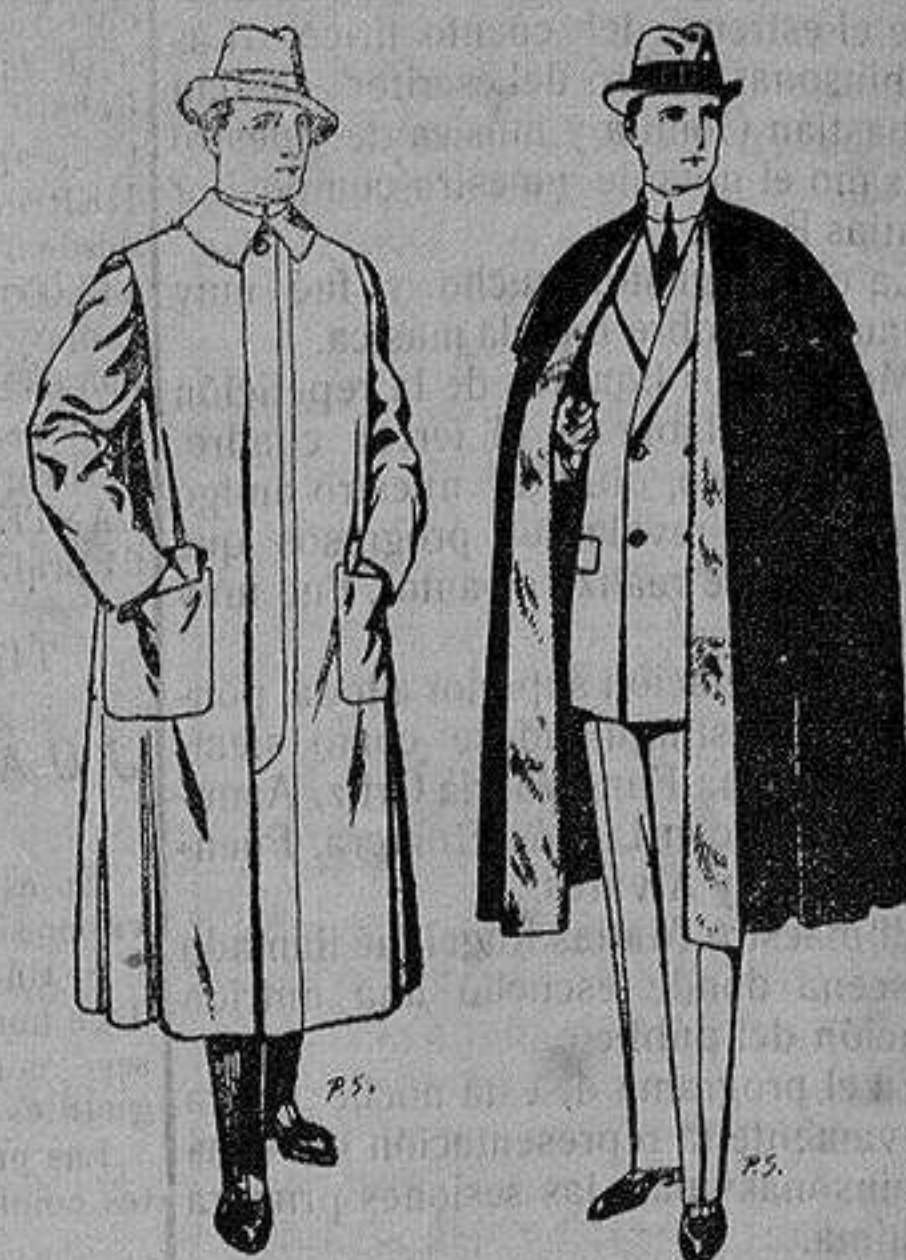
Impermeables forma gabán en color beige o gris De ptas. 35 a 100