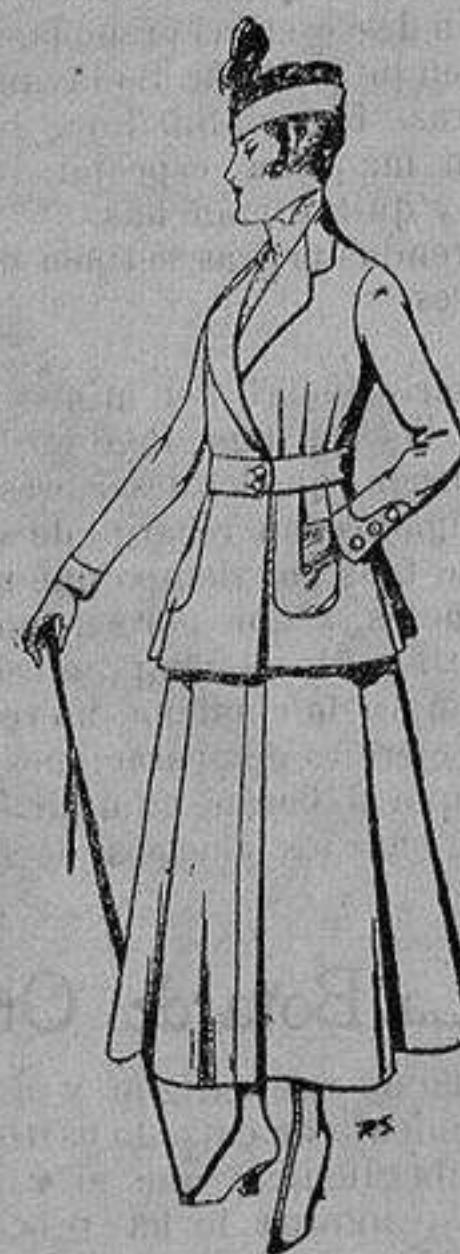
Trajes de lana negra azul y color, para señora De ptas. 50 a 55

Ropas confeccionadas para Caballero, Señora, Niño y Niña