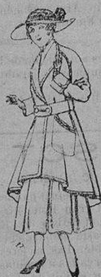
Abrigos de patén para jovencitas de 13 a 16 años De ptas. 25 a 35