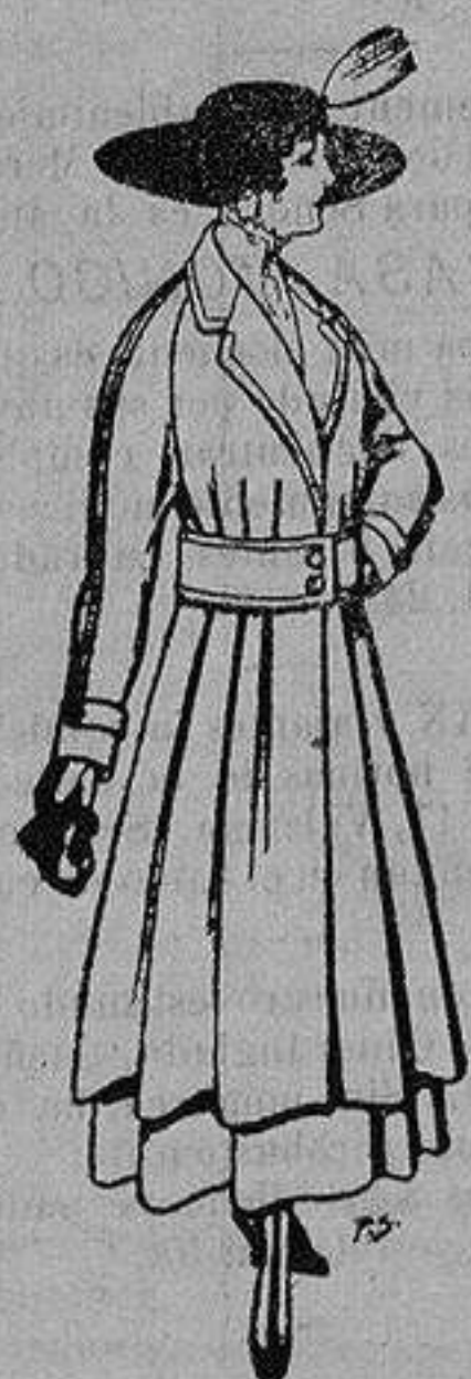
Abrigos de patén gran novedad para señora A ptas. 58

Ropas confeccionadas para Caballero, Señora, Niño y Niña