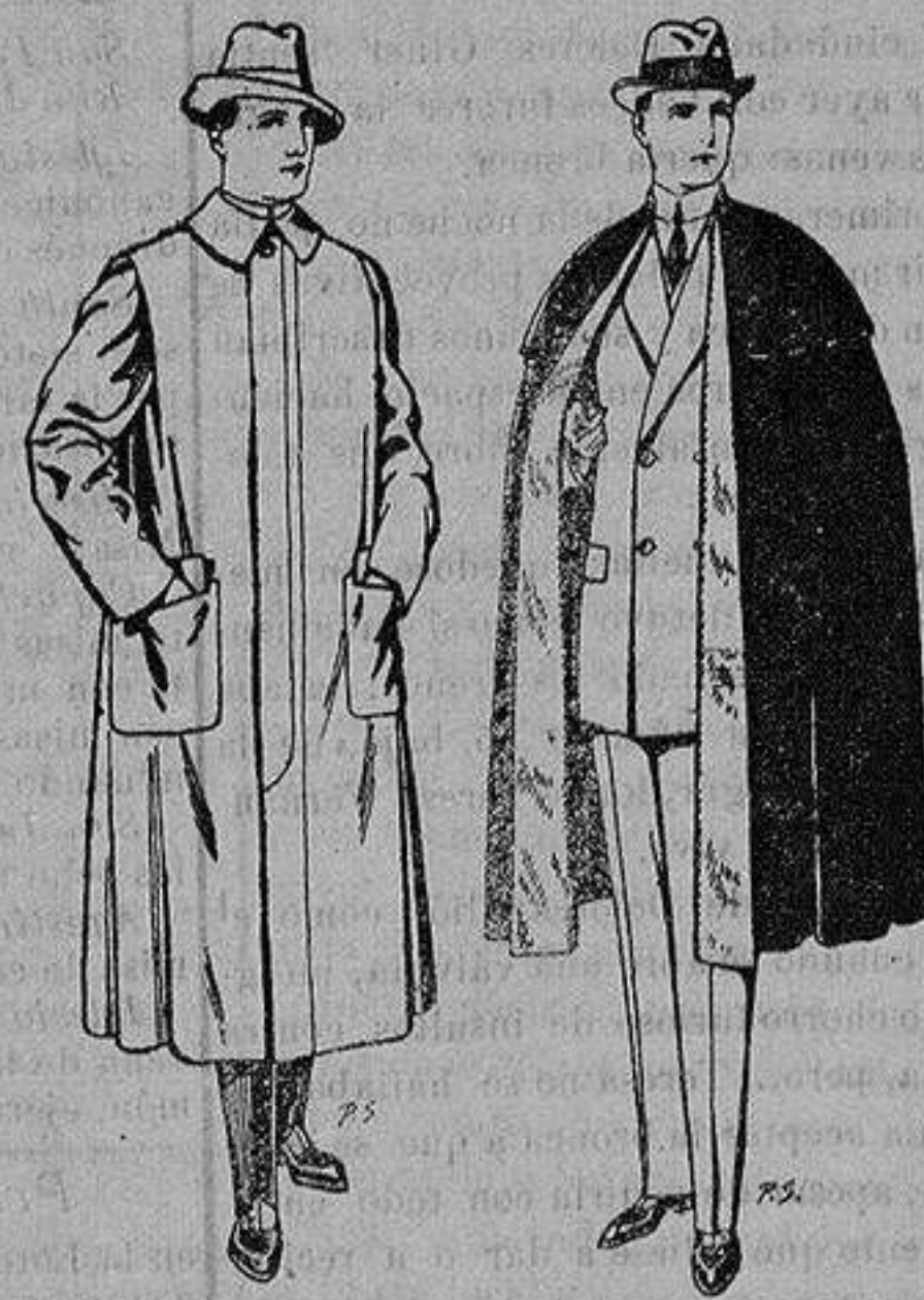
Impermeables forma gabán en color beige o gris De ptas. 35 a 100