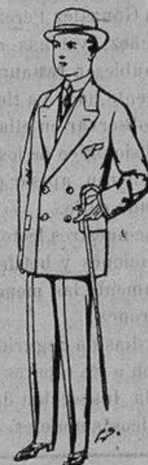
Trajes de patén, vicuña, etc., para niños de 10 a 16 años De ptas. 25 a 48