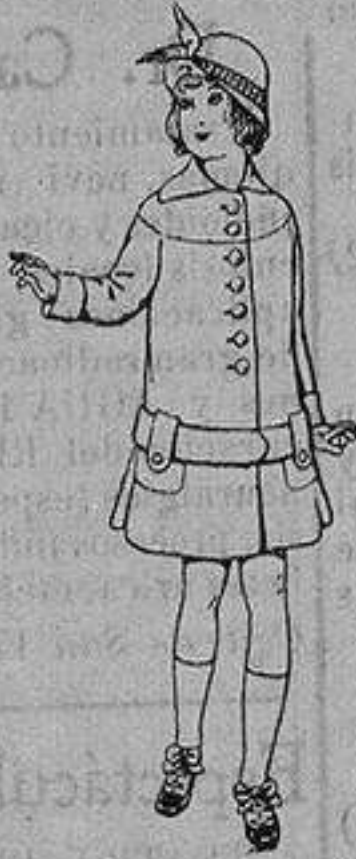
Abrigos de patén para niños de 4 a 12 años De ptas. 15 a 25