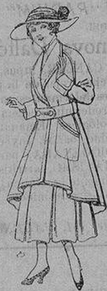
Abrigos de patén para jovencitas de 13 a 16 años De ptas. 25 a 35