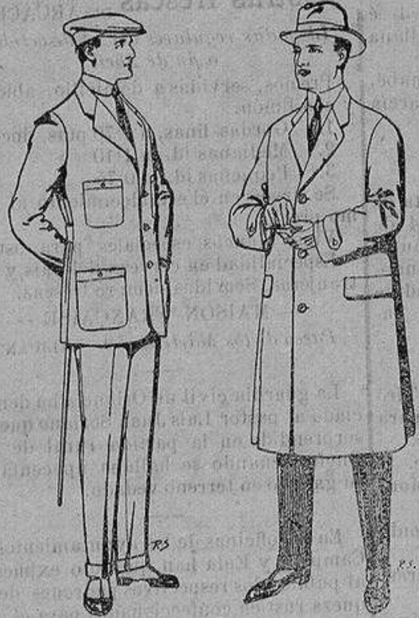
Trajes de cheviot corte elegante para «Sportman» De 35 a 50 ptas.

Peletería, Camisería, Generos de Punto, Corbatería, Guantería, Sombrerería, Zapatería, Paraguas, Bastones y Artículos de Viaje.