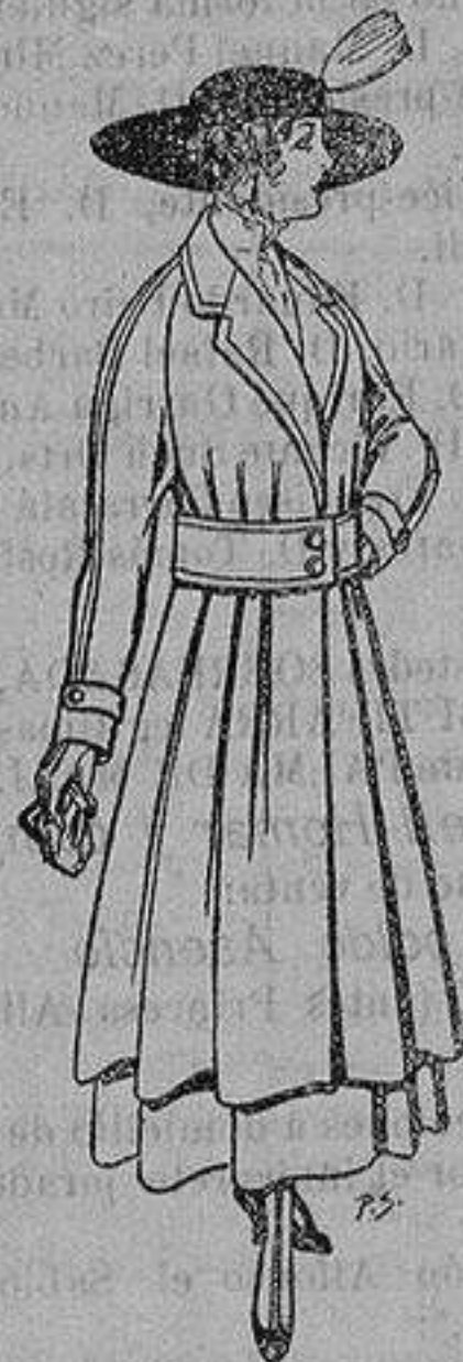
Abrigos de patén gran novedad para señora A ptas. 53