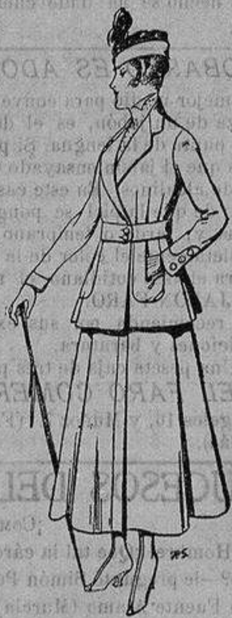
Trajes de lana negra azul y color, para se- ñora De ptas. 50 a 55