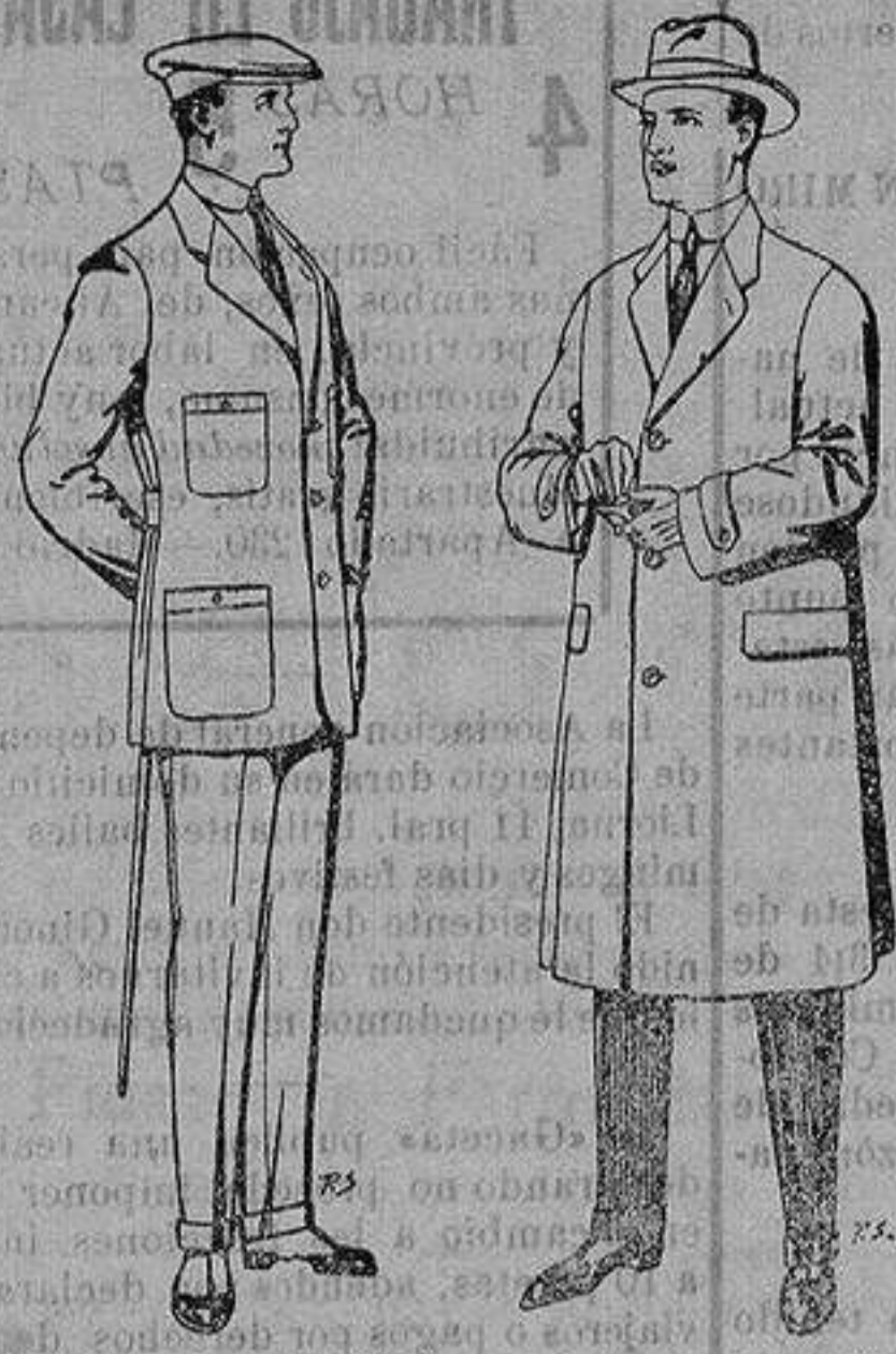
Trajes de cheviot corte elegante para "Sportman" De 35 a 50 ptas. Gabanes de tejido plumá o satina De ptas. 30 a 100

Madrid, Barcelona, Alicante, Almería, Bilbao, Gá- diz, Cartagena, Gijón, Granada, Málaga, Palma de Mallorca, Santander, Sevilla, Valencia, Valla- dolid y Zaragoza