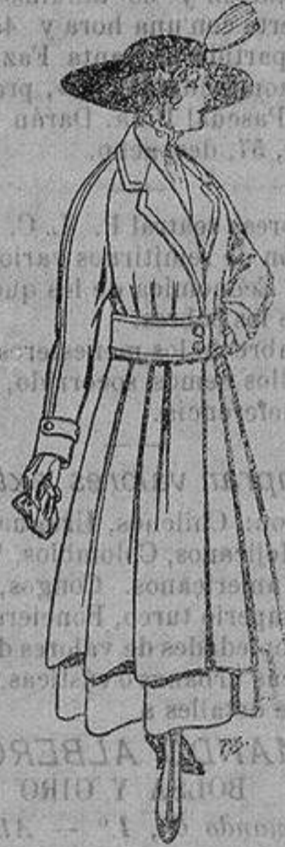
Abrigos de patén gran novedad para señora A ptas. 53