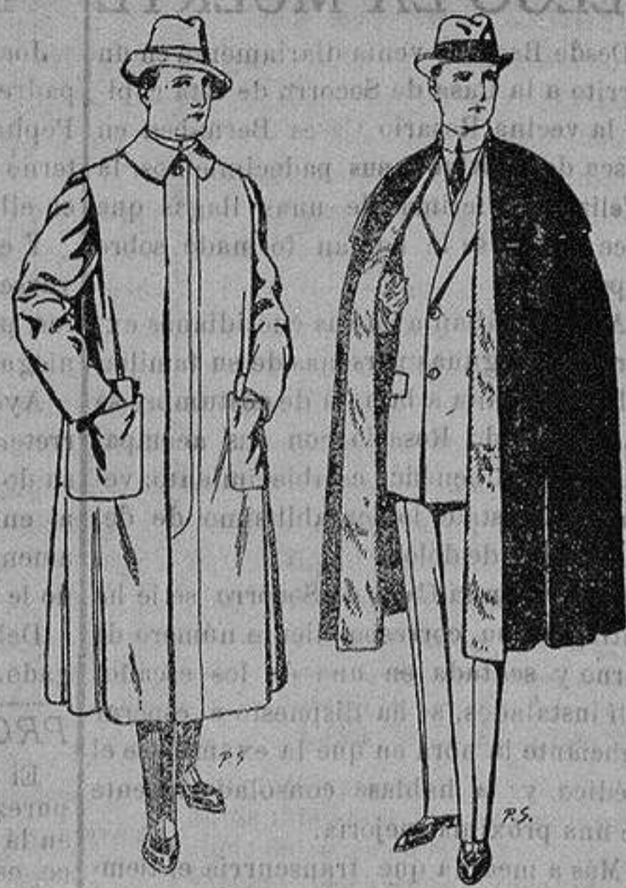
Impermeables forma gabán en color beige o gris De ptas. 35 a 100 Capas (enteras) de paño De ptas. 25 a 100

Peletería, Camisería, Generos de Punto, Corbatería, Guantería, Sombrerería, Zapatería, Paraguas, Bas- tones y Artículos de Viaje.