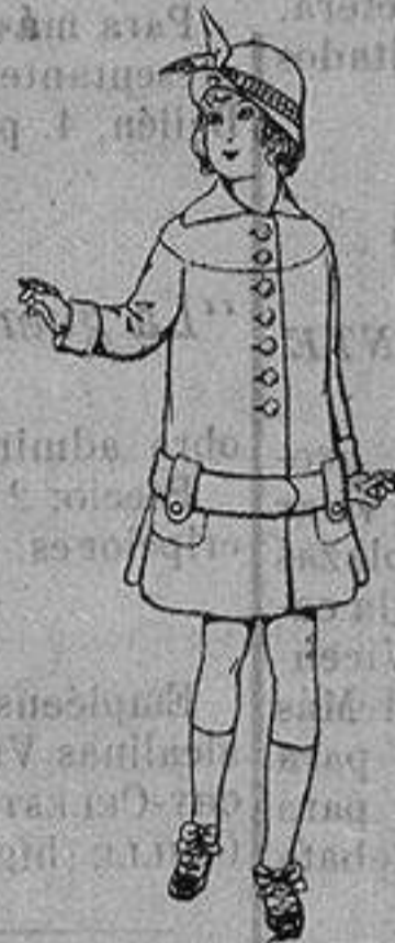
Abrigos de patén para niños de 4 a 12 años De ptas. 15 a 25

Ropas confeccionadas para Caballero, Señora, Niño y Niña