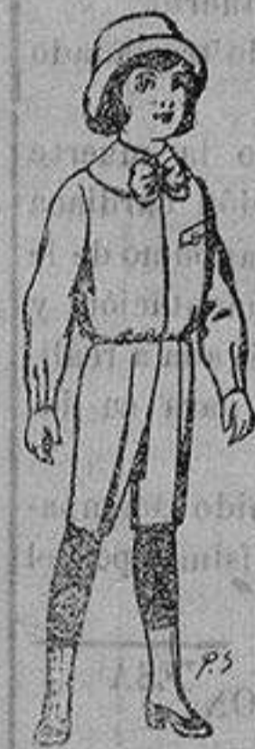
Trajes de patén para niños de 4 a 9 años De ptas. 5 a 7'50