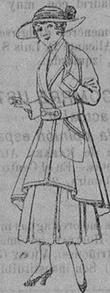
Abrigos de patén para jovencitas de 13 a 16 años De ptas. 25 a 35