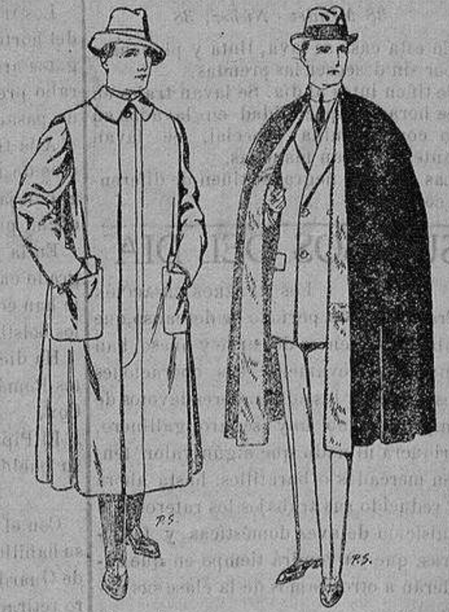
Impermeables forma gabán en color beige o gris De ptas. 35 a 100 Capas (enteras) de paño De ptas. 25 a 100