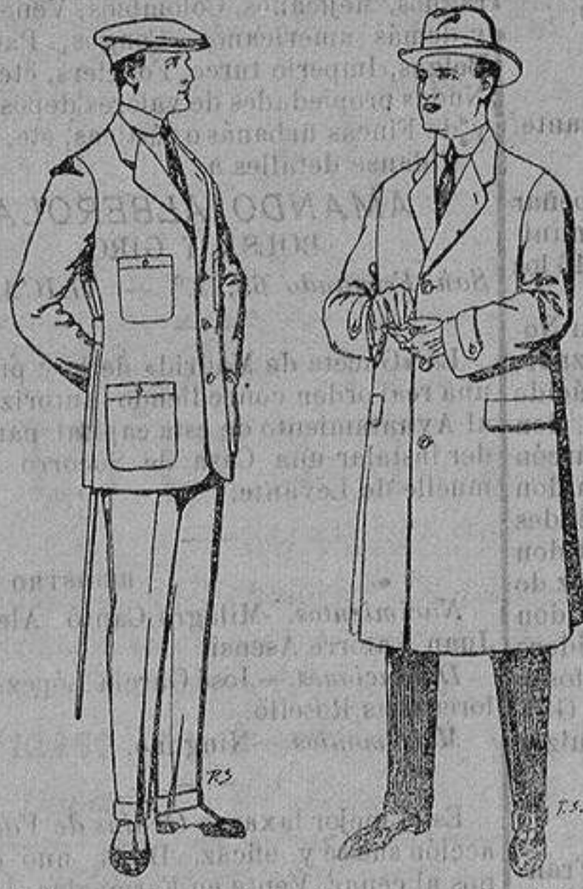
Trajes de cheviot corte elegante para «Sportman» De 35 a 50 ptas Gabanes de tejido pluma o satina De ptas. 30 a 100

Madrid, Barcelona, Alicante, Almería, Bilbao, Cádiz, Cartagena, Gijón, Granada, Málaga, Palma de Mallorca, Santander, Sevilla, Valencia, Valladolid y Zaragoza