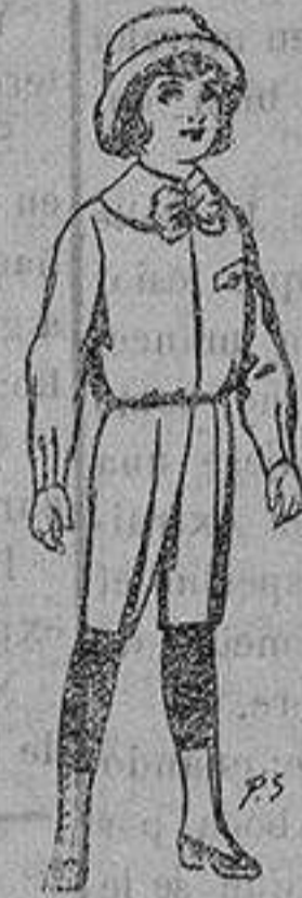
Trajes de patén para niños de 4 a 9 años De ptas. 5 a 7'50

Peletería, Camisería, Generos de Punto, Corbatería, Guantería, Sombrerería, Zapatería, Paraguas, Bastones y Artículos de Viaje.