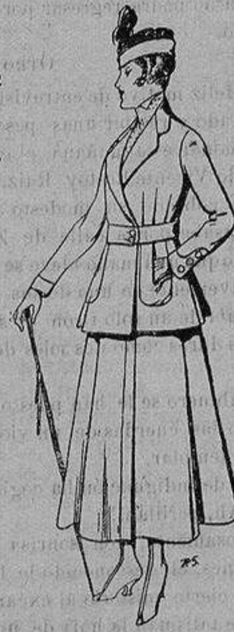
Trajes de lana negra azul y color, para señora De ptas. 50 a 55