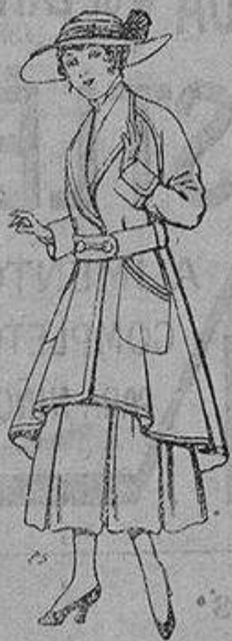
Abrigos de patén para jovencitas de 13 a 16 años De ptas. 25 a 35