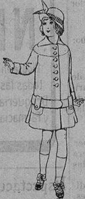
Abrigos de patén para niños de 4 a 12 años De ptas. 15 a 25