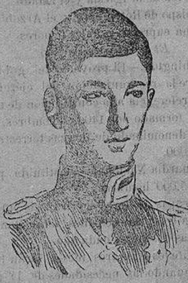
El príncipe BORIS, heredero al trono de Bulgaria que se ha puesto al frente de tres ejércitos, encargados de cortar el camino entre Nisch y Salónica.