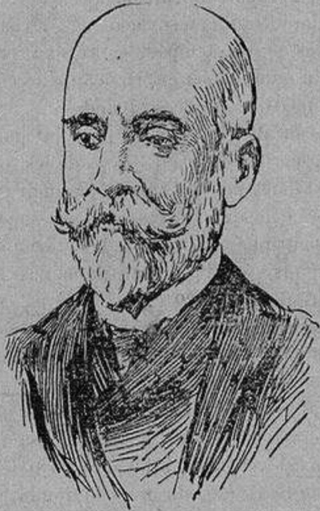
BERNARDINO MACHADO nuevo presidente de Portugal