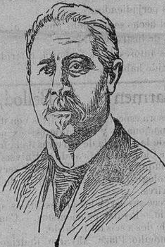
TEÓFILO BRAGA nuevo presidente de Portugal