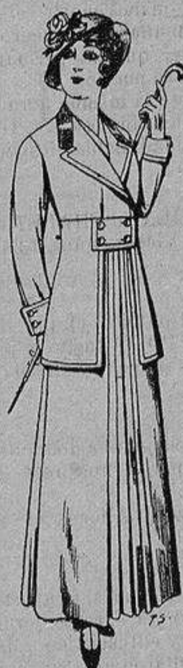
Trajes de lana ne- gra azul y color pa- ra señora A ptas. 70

Madrid * Barcelona * Almería * Bilbao * Cádiz Cartagena * Gijón * Granada * Málaga * Pal- ma de Mallorca * Santander * Sevilla * Valencia Valladolid y Zaragoza