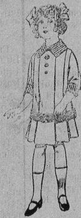
Vestidos de dril para niñas de 4 a 12 años De ptas. 5 a 12