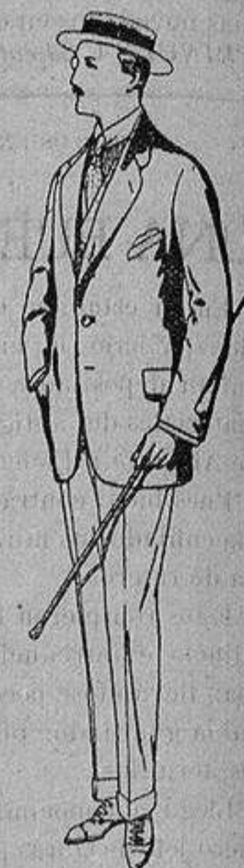
Trajes de alpaca negra De ptas. 32 a 56