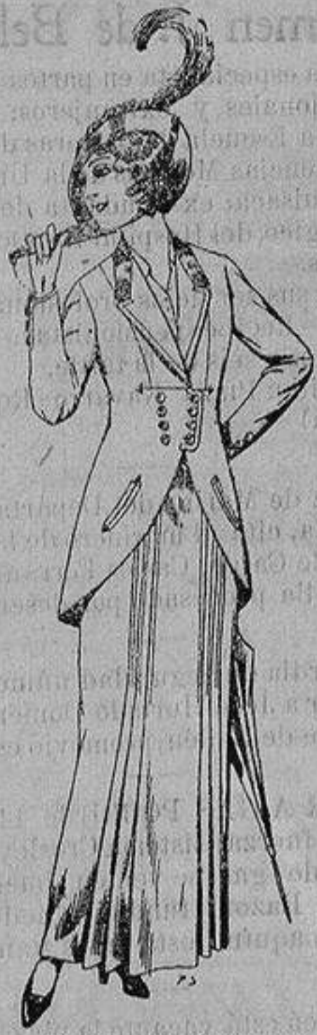
Trajes de lana ne- gra, azul y color pa- ra señora A ptas. 80