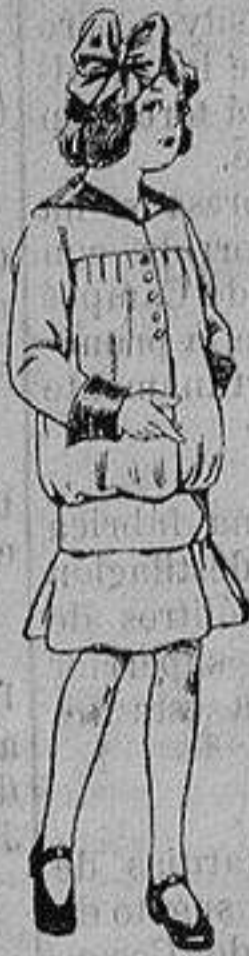
Vestidos lanilla para niñas de 4 a 12 años De ptas. 12 a 20