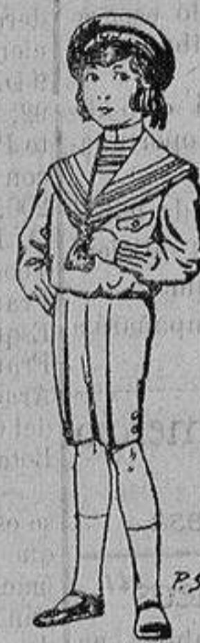
Trajes de la- nilla, vicuña ó jerga, para ni- ños de 4 a 9 años De ptas. 6 á 31