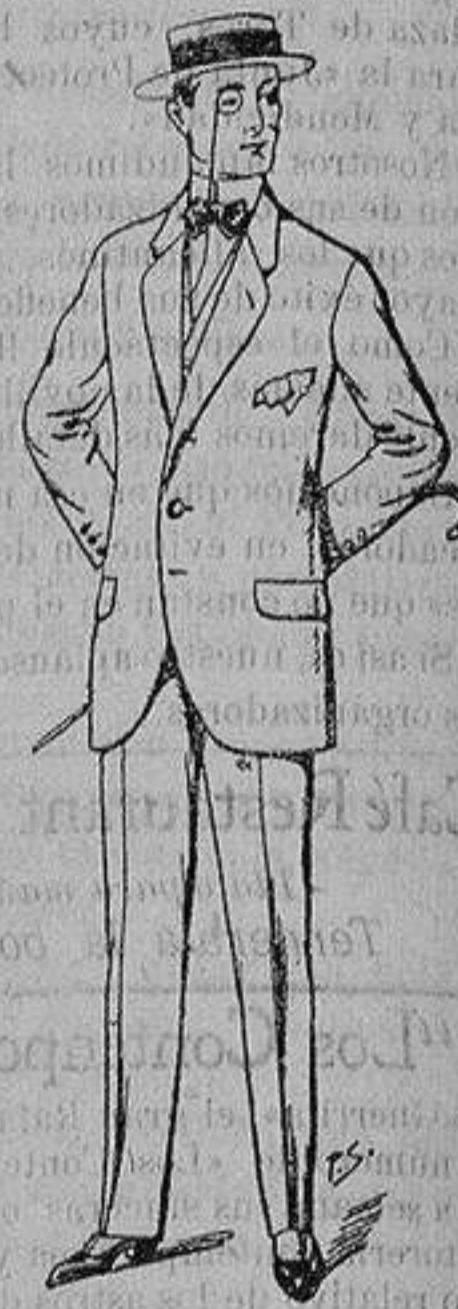
Trajes de lanilla, che- viot, etc. De ptas. 17:50 a 70