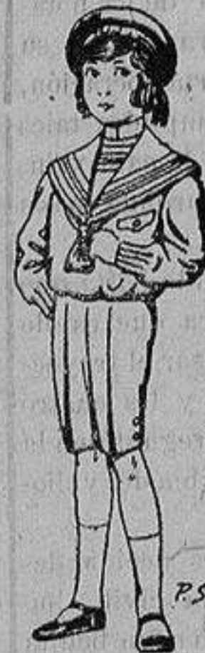
Trajes de la- nilla, vicuña ó jerga, para ni- ños de 4 a 9 años De ptas. 6 á 31