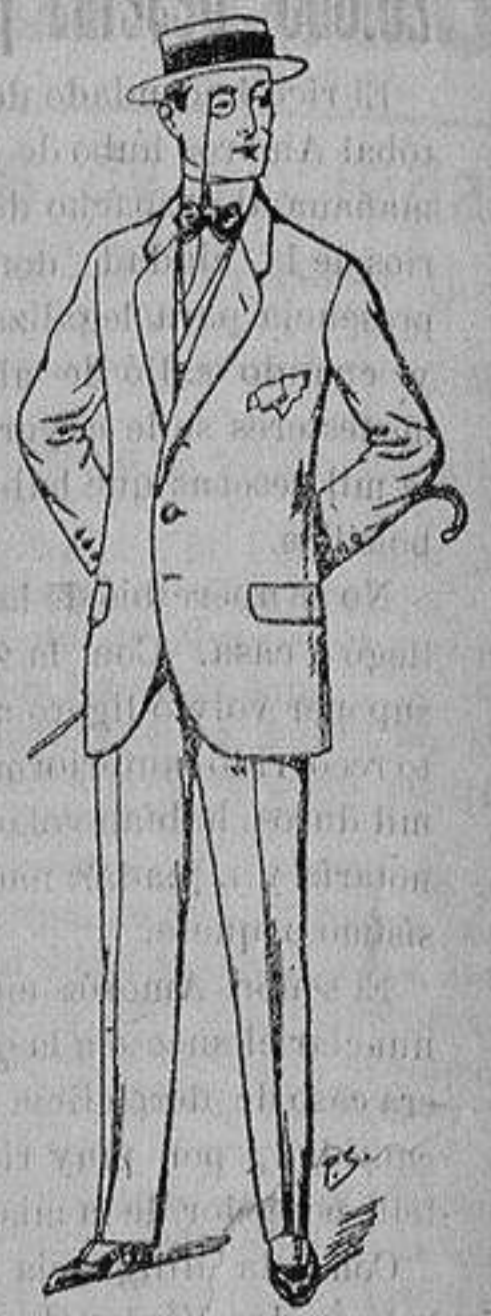
Trajes de lanilla, che- viot, etc. De ptas. 17'50 a 70