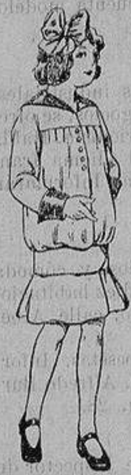
Vestidos lanilla para niñas de 4 a 12 años De ptas. 12 a 20