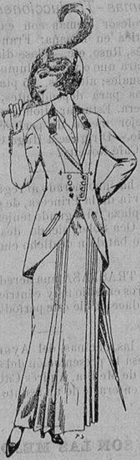
Trajes de lana ne- gra, azul y color pa- ra señora A ptas. 80