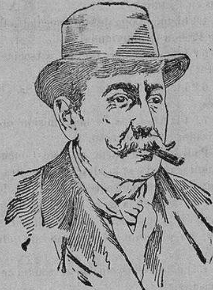
D. Benito Pérez Galdós

Hoy han sido estimados en su justo valor, la grandeza moral de «Los Condenados» y las muchas bellezas que tiene, no como obra literaria que es digna del renombre de su autor, sino como drama de ideas.