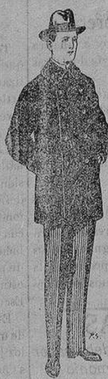
Pellizas con cuello y bocamangas de astrakan De 11 a 40 ptas

SECCIONES: Peletería, Camisería, Géneros de Punto, Corbatería, Guantería, Sombrerería, Zapatería, Paraguas, Bastones y Artículos de Viaje.