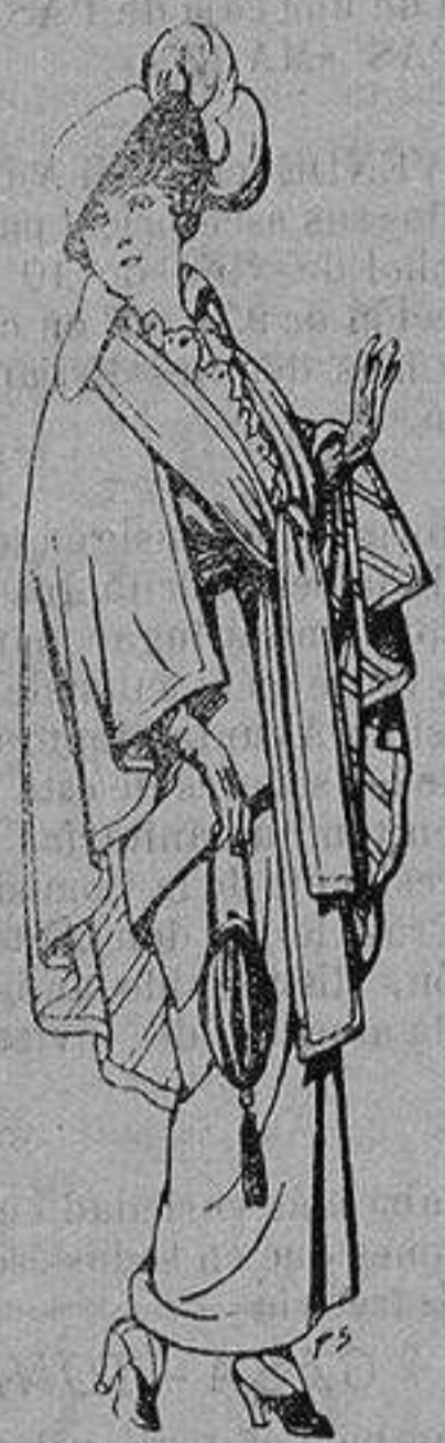
Capas de lana para señora A 20 ptas.