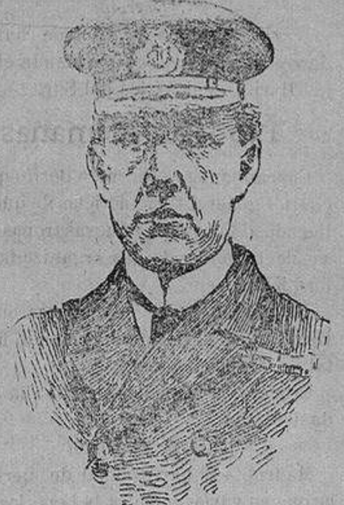
SIR G. WARRENDER Vice-almirante inglés