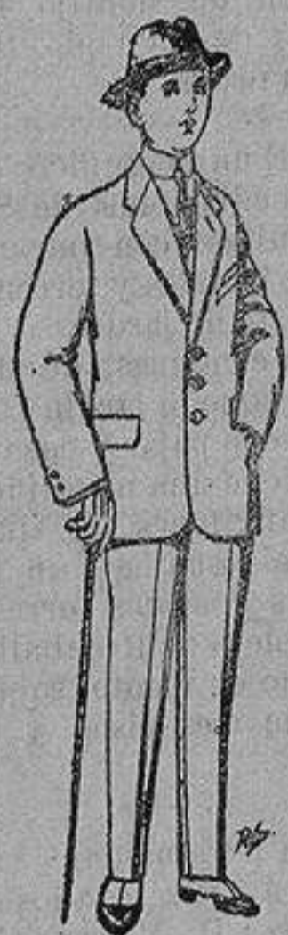
Trajes de paten, vicuña, etc., para niños de 10 a 16 años De 13 a 48 ptas.