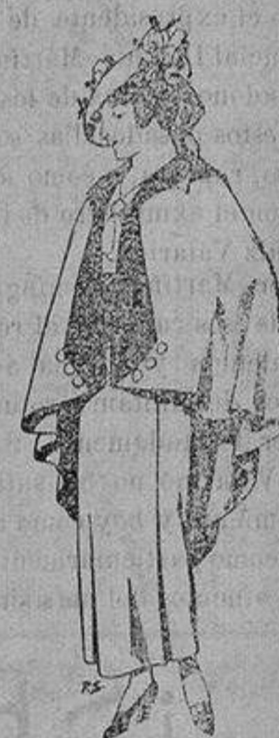
Capas de lana para jovencitas de 13 a 16 años A 25 pesetas