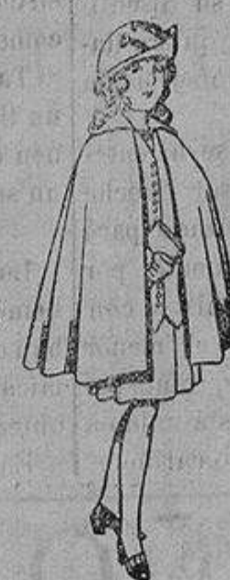
Capas de lana para niñas de 4 a 12 años De 20 a 22 ptas.