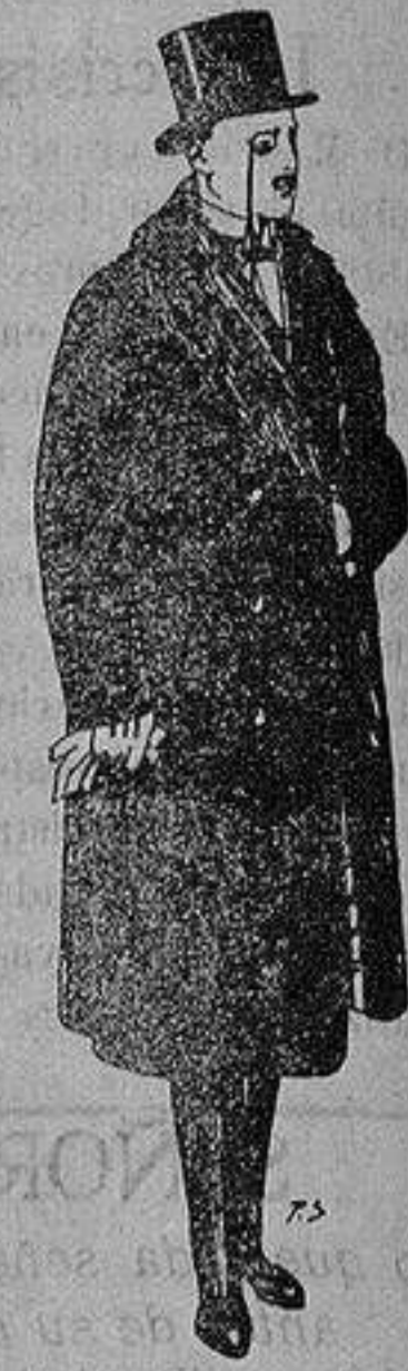
Gabanes de edredón negro, forro seda, cuello y vistas de piel a 125 ptas.