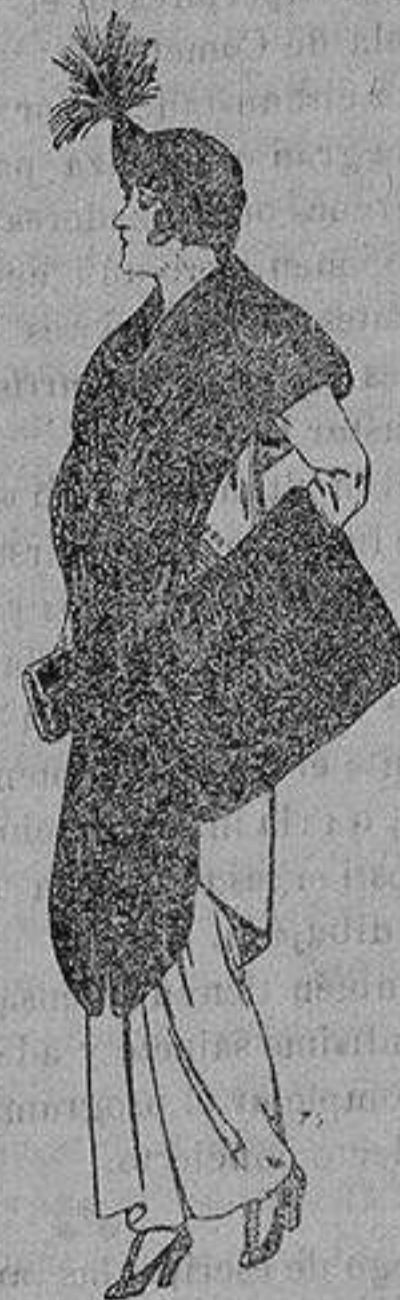
Juego de pieles de loutre de Nord para Señora 145 ptas.