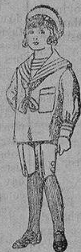
Trajes de jerga azul bordado oro en la manga para niños de 4 a 9 años De 20 a 22 ptas.

Ropas confeccionadas para Caballero, Señora, Niño y Niña