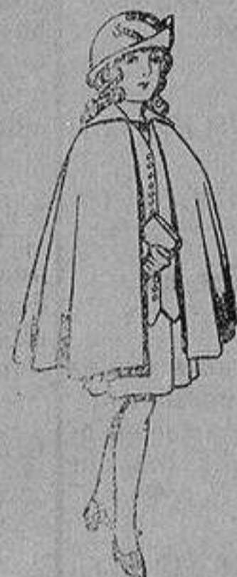
Capas de lana para niñas de 4 a 12 años De 20 a 22 ptas.

SECCIONES: Peletería, Camisería, Géneros de Punto, Corbatería, Guantería, Sombrerería, Zapatería, Paraguas, Bastones y Artículos de Viaje.