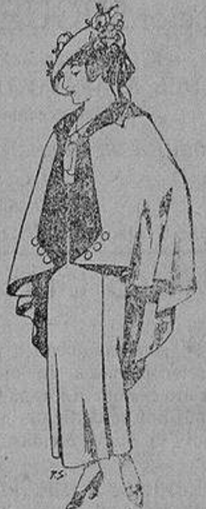
Capas de lana para jovencitas de 13 a 16 años A 25 pesetas