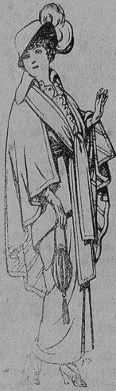
Capas de lana para señora A 20 ptas.