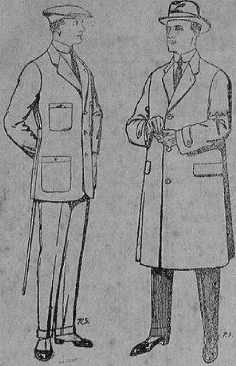
Trajes de cheviot, corte elegante para «Sportmen» De 45 a 55 ptas.

Madrid, Barcelona, Alicante, Almería, Bilbao, Cádiz, Cartagena, Gijón, Granada, Málaga, Palma de Mallorca, Santander, Sevilla, Valencia, Valladolid y Zaragoza