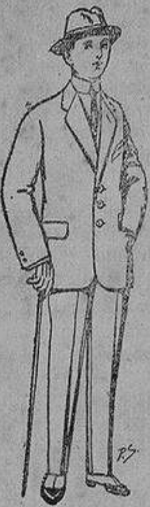
Trajes de paten, vicuña, etc., para niños de 10 a 16 años De 13 a 48 ptas.