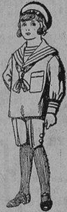
Trajes de jerga azul bordado oro en la manga para niños de 4 a 9 años De 20 a 22 ptas.

Ropas confeccionadas para Caballero, Señora, Niño y Niña