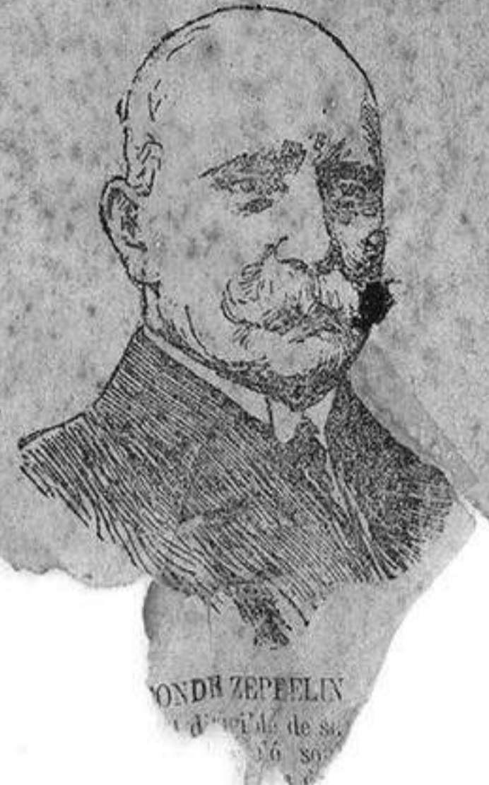
FIGURAS DE LA GUERRA

Roma.—Telegrafían de Poiniza que los albanes es católicos atacaron a los montenegrinos, derrotándoles.