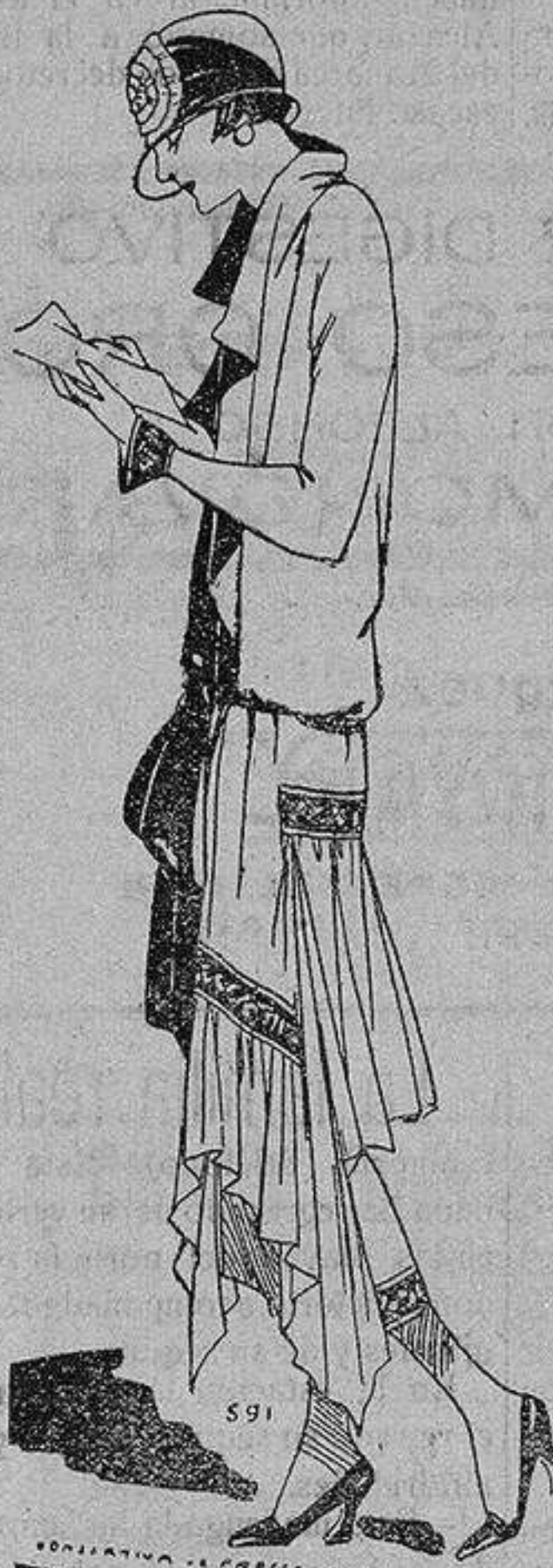
Vestido en crepé georgette escema adornado de crepé rubí.