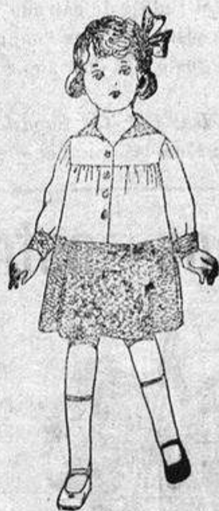
Vestidos de etatin blanco, combinados etatin listado, para niñas de 3 a 6 años, de pesetas 6'50 a 8'50.