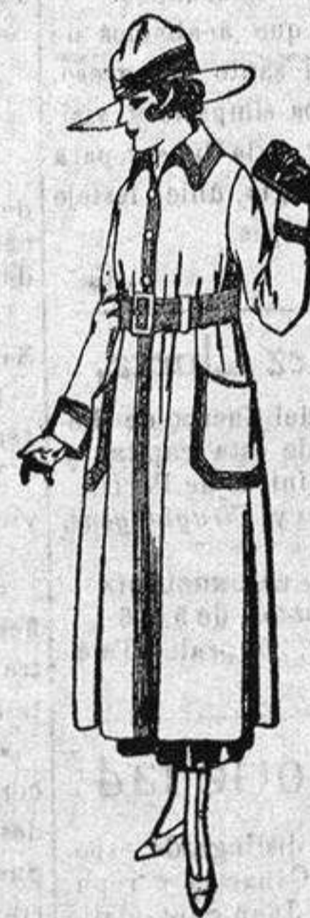
Abrigos de gabardina inglesa impermeabilizados, en color beige, bordados, de ptas. 80 a 95.