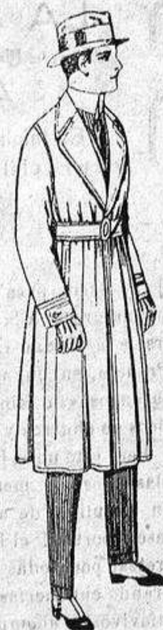
Gabanes de gabardina impermeabilizada, diferentes colores, de pesetas 43 a 15.