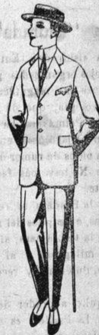
Trajes de dril crudo, kaki o listado, para jovencitos de 10 a 16 años, de ptas. 19 a 55.