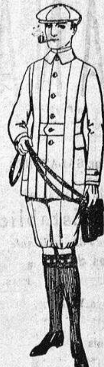
Cazadora de dril crudo o kaki, de ptas. 15 a 18. Pantalones cortos para excursionistas, en dril, beige y gris, de pesetas 9 a 15.