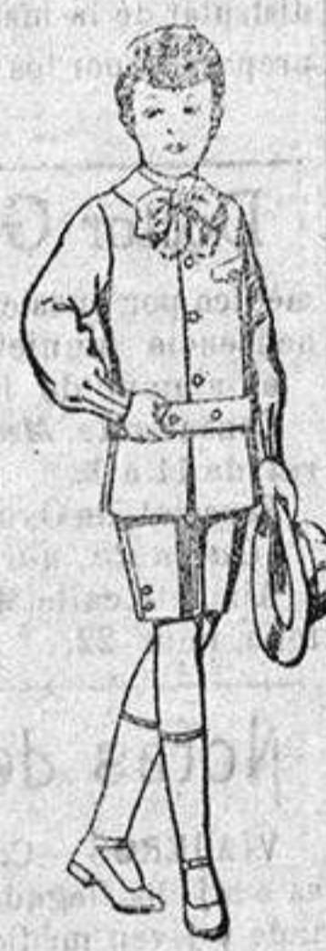
Trajes de lanilla melton, etc., para niño de 4 a 9 años, de pesetas 10 a 18.