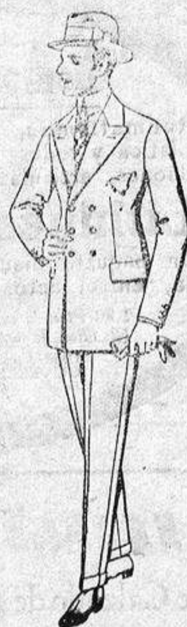
Trajes de lanilla melton, estambre, etc., de ptas. 32 a 90