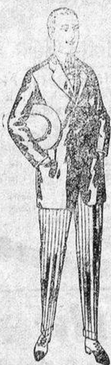
Traje de alpaca, negra o azul, de ptas. 35 a 60. Bañalones de dril o franela, blanca o listada de ptas. 6'50 a 30.

Madrid, Barcelona, Almería, Bilbao, Cádiz, Cartagena, Gijón, Granada, Málaga, Palma de Mallorca, Santander, Sevilla, Valencia Valladolid y Zaragoza.