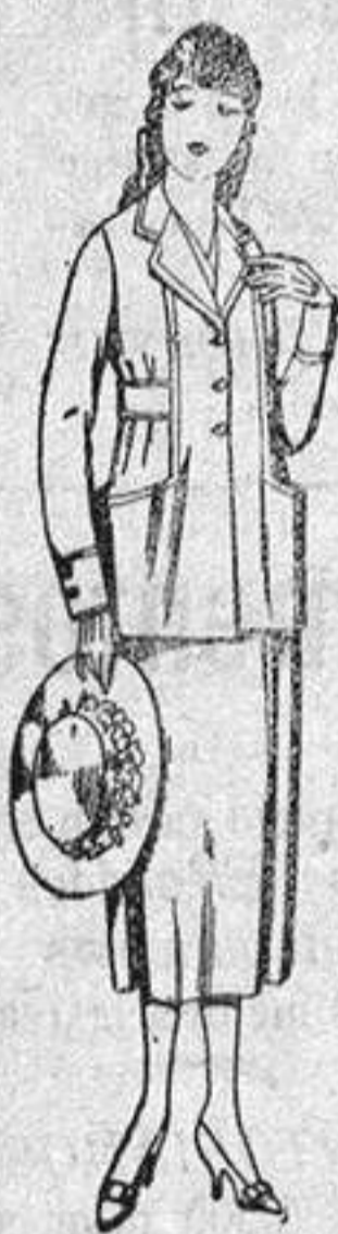
Trajes de estambre, gabardina, etc., en azul y calor, de pesetas 48 a 58.