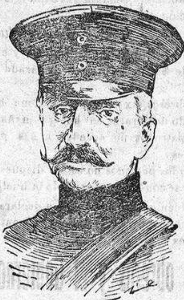
VON BELOW comandante de las fuerzas austro-alemanas que operan en Italia