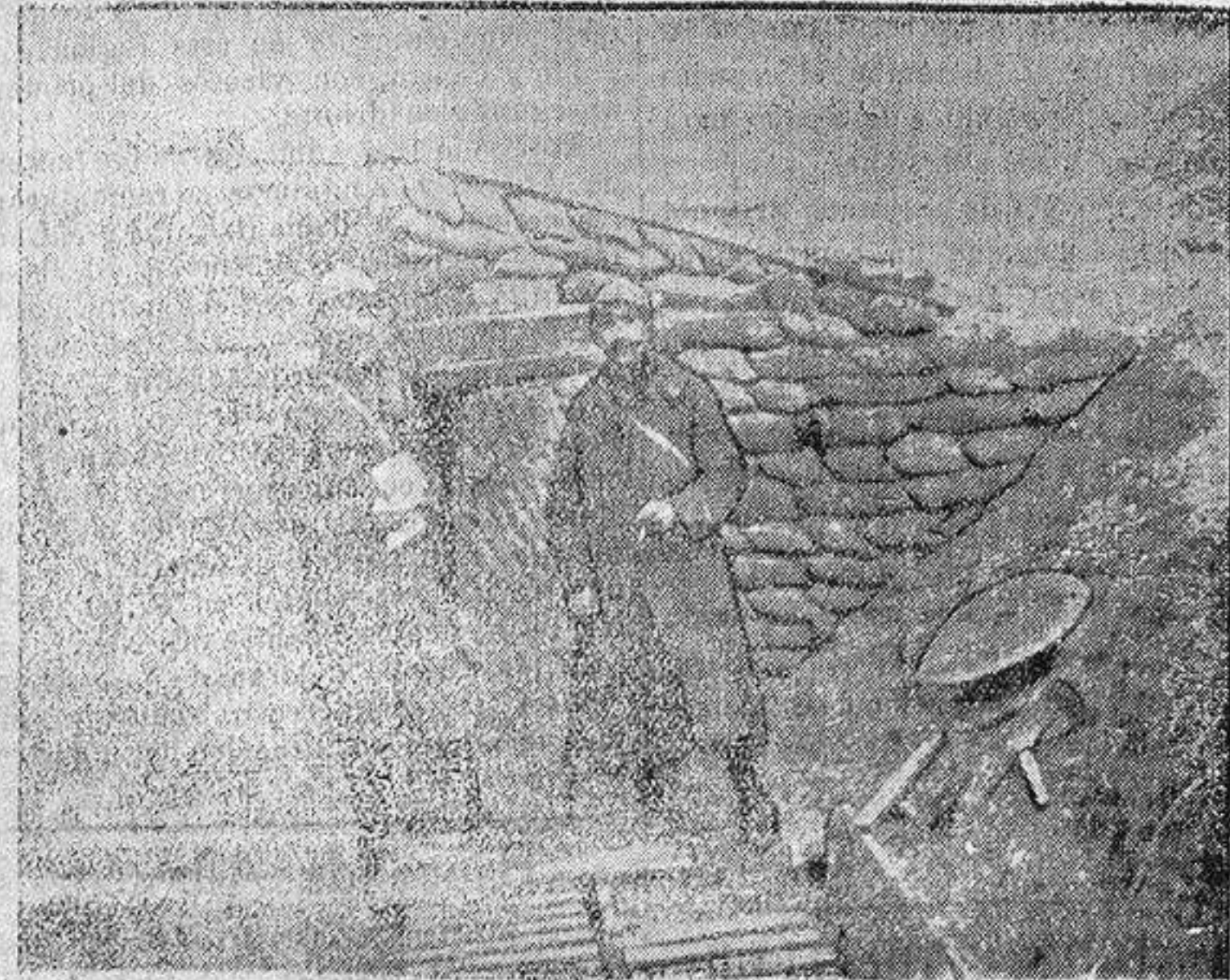
Puestro de mando de un coronel de Infantería francés