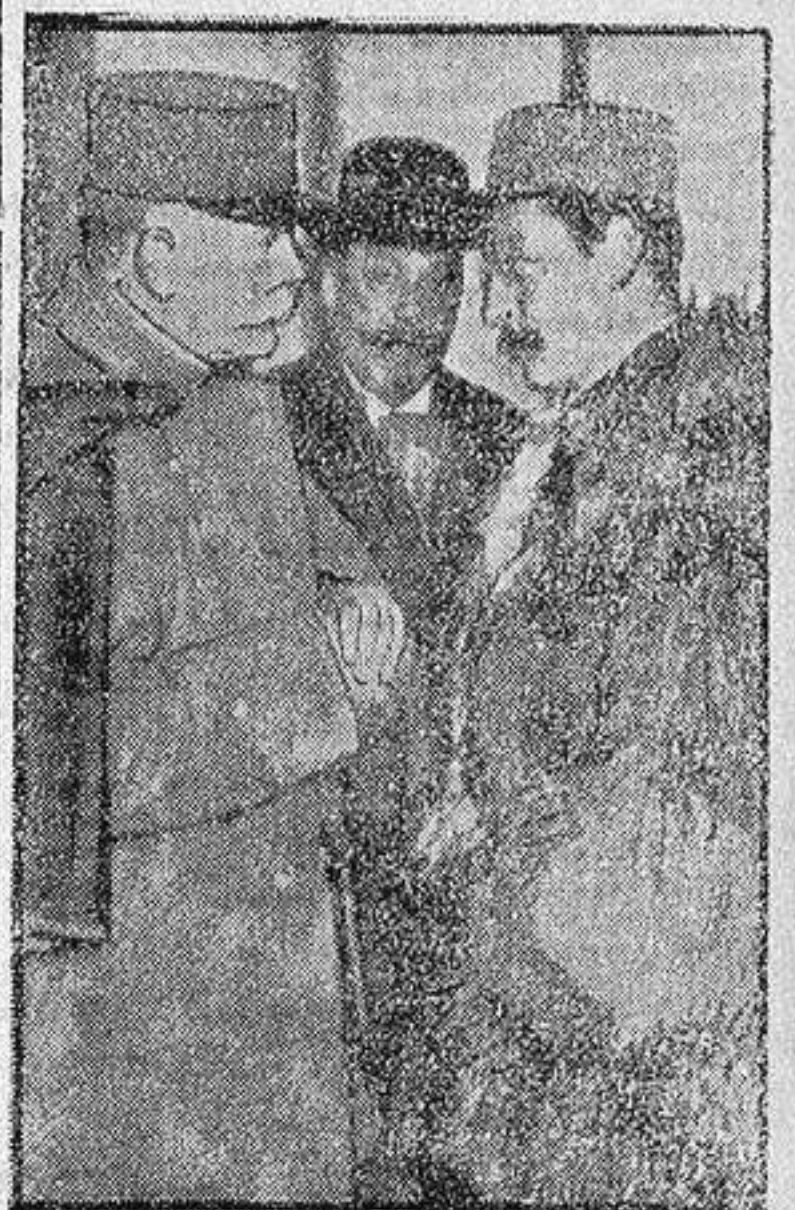
Llegada a París del general Sarrail