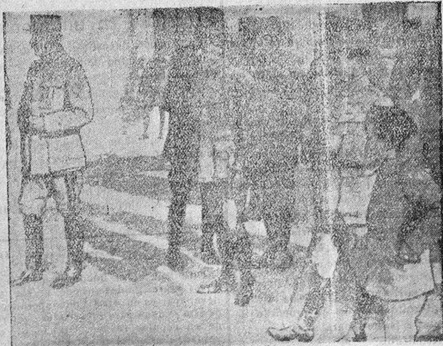
El general Maistre, presenciando el desfile de los prisioneros hechos en el Monte Tomba