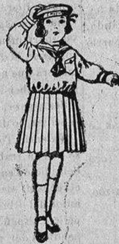
Trajes de marinera de sarga inglesa azul, para niñas de 4 a 9 años, de ptas. 30 a 38.