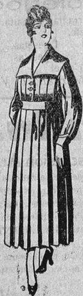
Batas de lanilla diferentes colores, a pesetas, 25.

Madrid, Barcelona, Alicante, Almería, Bilbao, Cádiz, Cartagena, Gijón, Granada, Málaga, Palma de Mallorca, Santander, Sevilla, Valencia, Valladolid y Zaragoza.