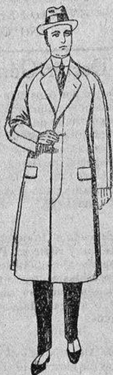
Gabanes de patén, melton o cheviot, con forro de seda, satén o escocés, de ptas. 50 a 100