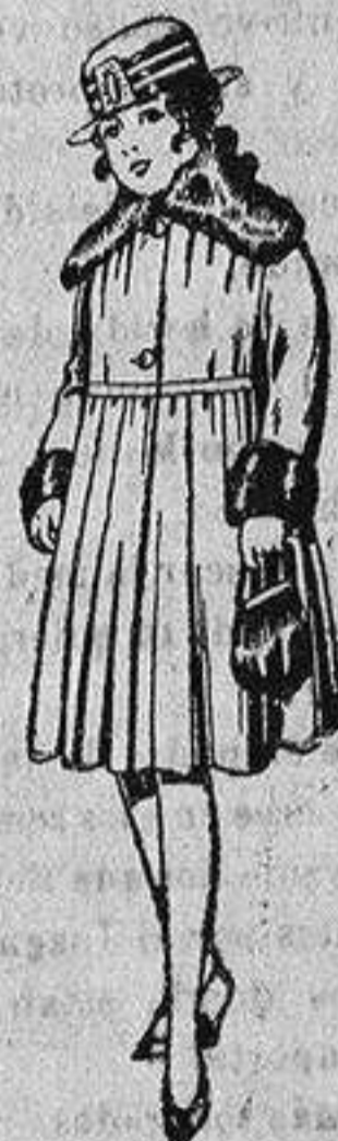
Abrigos de terciopelo de lana, pañete, guma, etc., cuello y boca mangas piel, para niñas de 4 a 9 años, de pesetas 28 a 48

PRECIO FIJO - VENTAS AL CONTADO - Pídase el Catálogo general