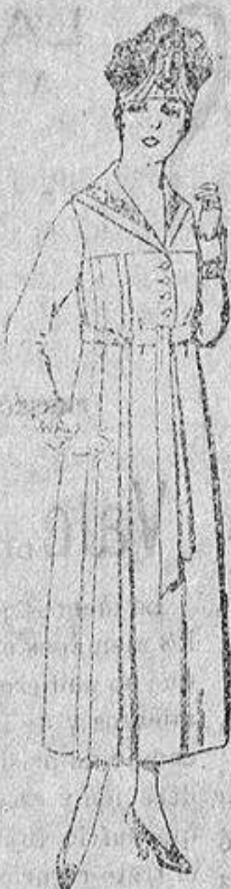
Vestidos de sarga inglesa, en negro, azul y color, bordados, de de ptas. 60 a 70.