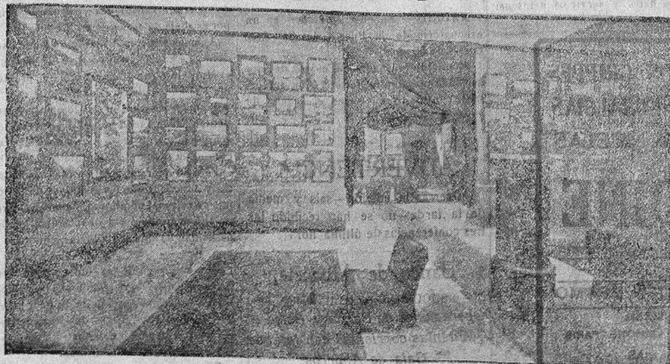
Exposición interaliada de fotografías de la guerra