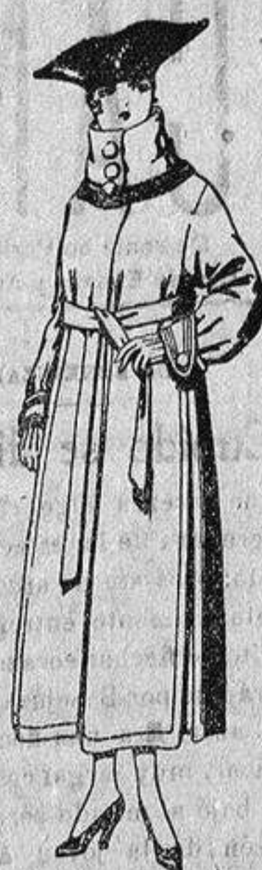
Abrigos de pañete, colores azul, beige y café, de pas. 65 a 85.