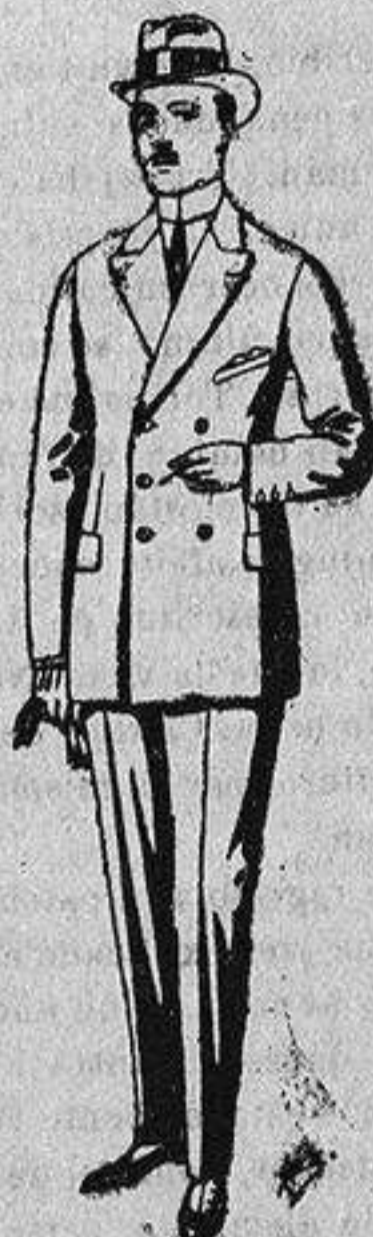
Trajes de cheviot, melton etc., de ptas. 26 a 85. Los mismos en vicuña o jerga, de ptas. 32 a 90.

Camisería - Géneros de punto Gorbatería - Guantería Sombrerería - Zapatería Paraguas - Bastones y artículos - - - de viaje - - -