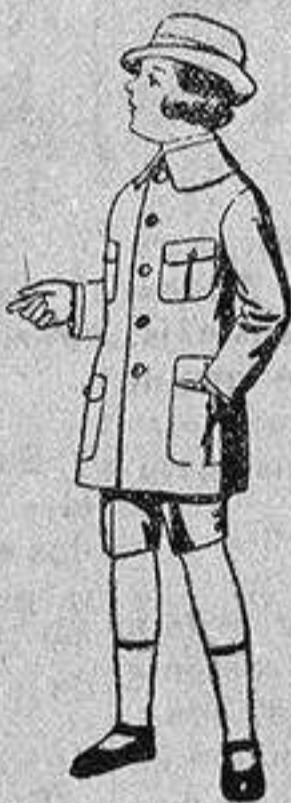
Trajes de patén modelo «Sport», para niños de 4 a 9 años.